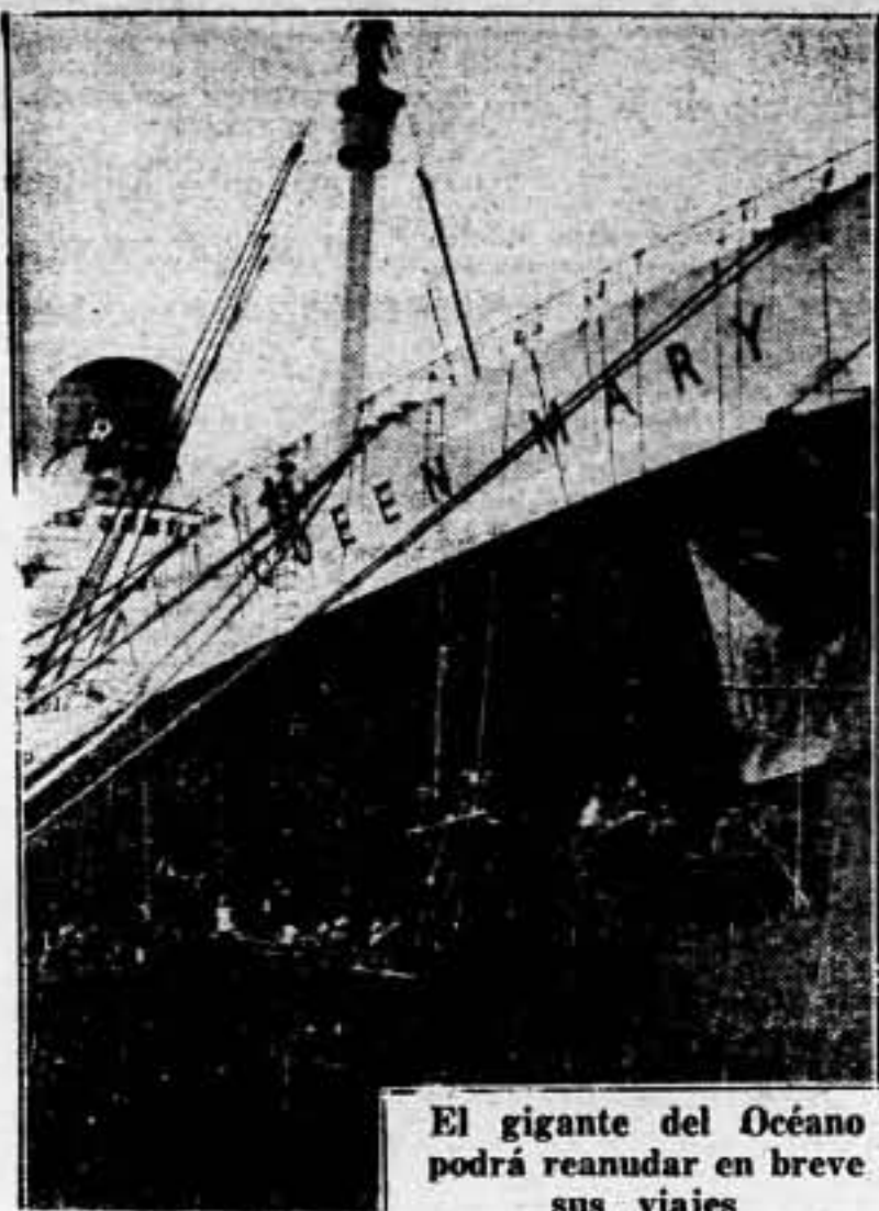
El gigante del Océano podrá reanudar en breve sus viajes

En el dique flotante de Southampton, los pintores dan los últimos toques al "Queen Mary", nuevamente pintado y que en breve reanudará sus viajes