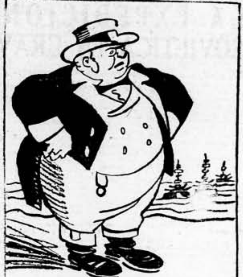
John Bull y la No Intervención: ¿Tendré que enfadarme? (De "Claridad")

Berlín, 5. — Por decisión de Hitler, el Ministerio de Economía ha quedado subdividido, a partir de hoy, en cinco departamentos para las diferentes actividades: Comercio, Minas, Electricidad, Importación y Exportación, etc. — Cosmos.