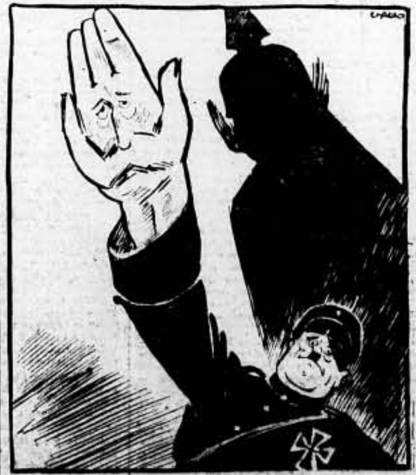
EL «FURBER», NUEVO MINISTRO DE LA GUERRA ALEMÁN, SALUDA AL FUERBER