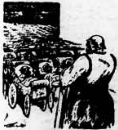
LA CONFERENCIA DE 1934