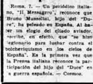
LA FIGURA DEL DIA

Roma, 7. — Un periódico italiano, «Il Messaggero», reconoce que Bruno Mussolini, hijo del «Duce», ha peleado en España. Al haber un elogio del citado aviador, «scribe», en efecto, que «se hizo voluntario para luchar contra el bolcheviquismo en los cielos de España». Es la primera vez que la Prensa italiana reconoce la participación del hijo del «Duce» en una guerra española. — Cosmos.