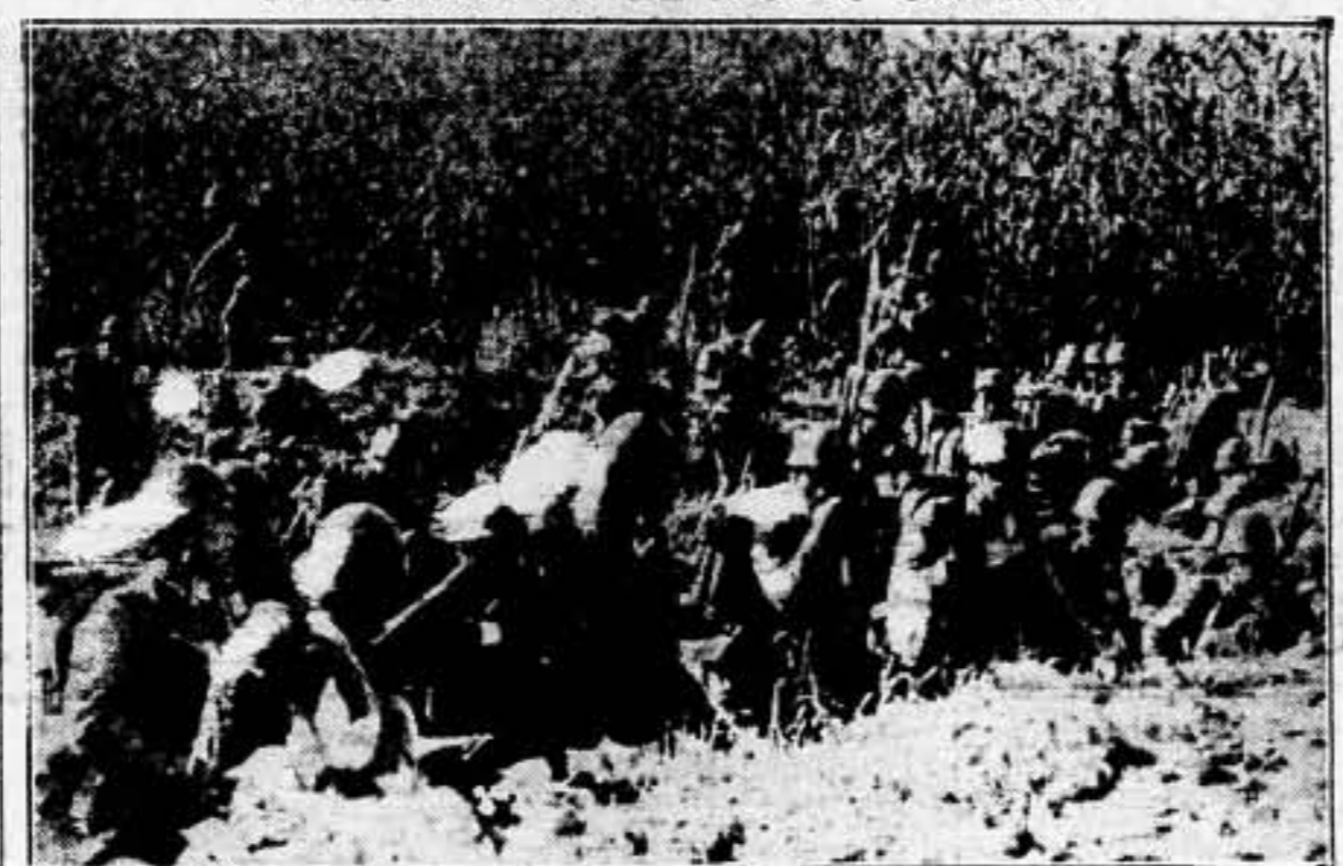
Fotografía tomada en los alrededores de Shanghai...