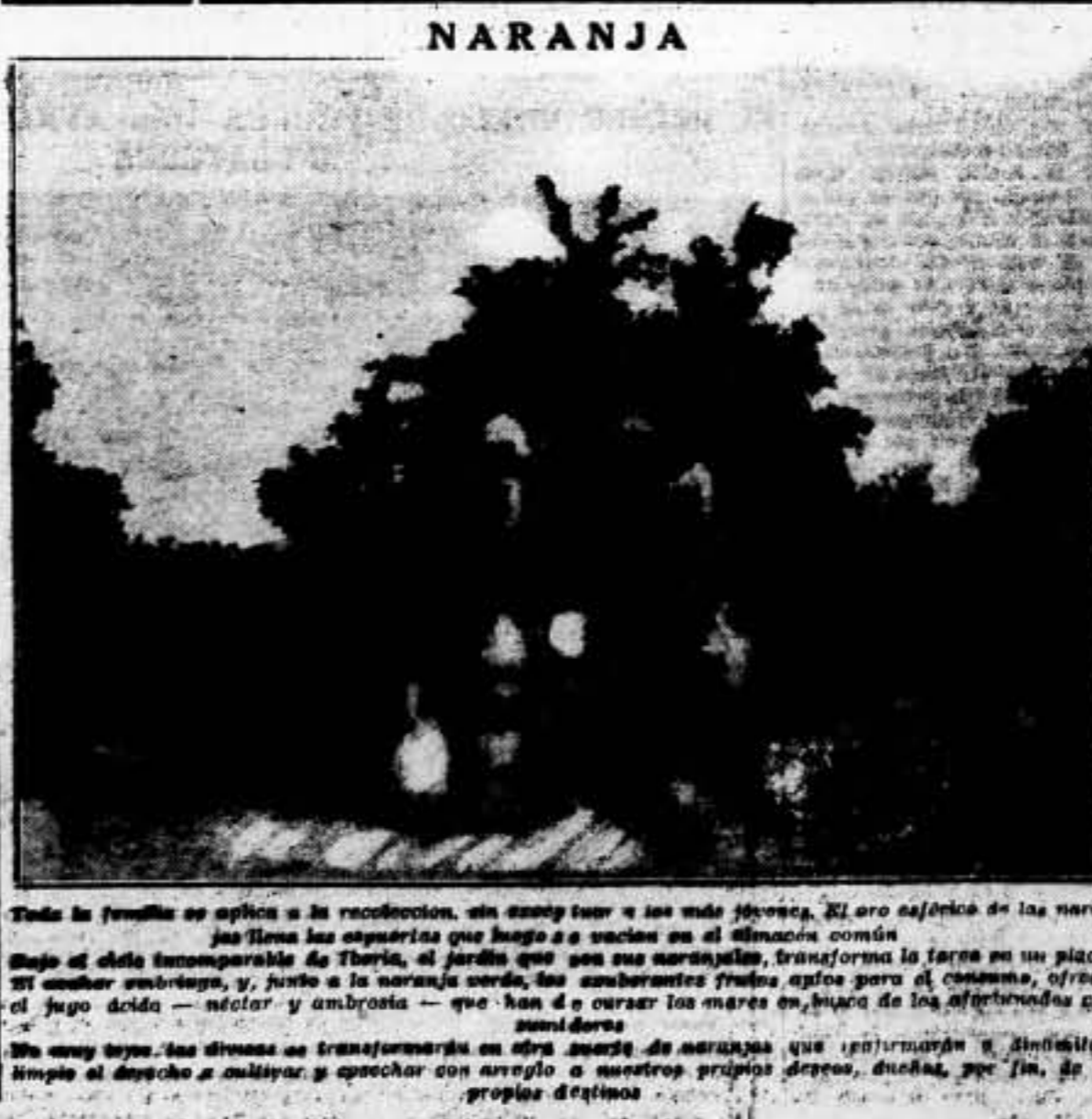
Toda la familia se aplica a la recolección, sin exceptuar a los más jóvenes...

Telefonos de «SOLIDARIDAD OBRERA» Redacción ... 3000