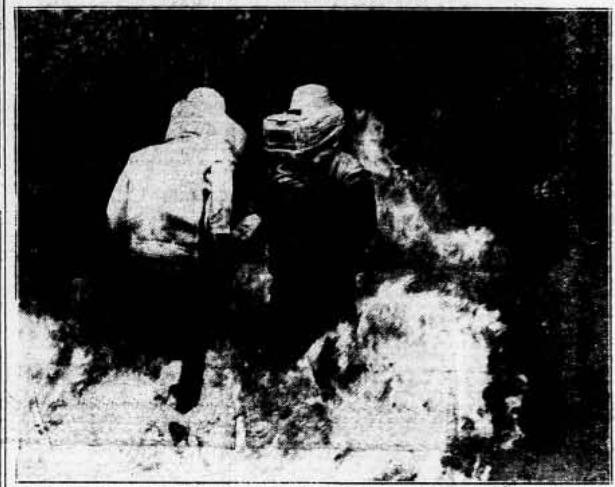
En vista de la frecuencia con que se producen los incendios en los aeródromos británicos, las brigadas de bomberos han sido dotadas de trajes de amianto que les permite desenvolverse entre las llamas sin el menor peligro de quemarse.