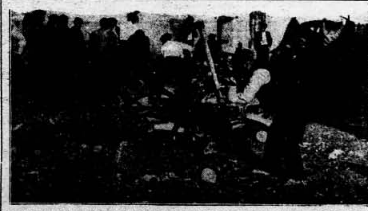
La solidaridad entre soldados y campesinos es una de las bases de nuestra victoria. En esta "foto" se ven los campesinos de un lugar castellano preparando leña para mitigar el frío de los combatientes, como prueba de política solidaria.