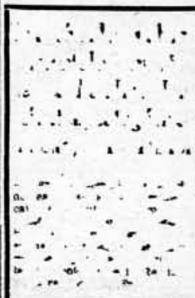
Memoria: Hemos recibido la siguiente información del explorador Papanin: «La noche del 7 al 8 de febrero, una tempestad destruyó la tienda que servía de habitación y la que cubría los aparatos de T. S. H. Construíamos una casa de nieve y estacionamos una vez de nieve y estacionamos por primera vez las costas, instalamos la T. S. H. en un nuevo lugar; flotamos y continuamos perturbando las costas; el hielo empieza a solidarse; todo va bien.» P. b. r.

DESFILE EN BUENOS AIRES. Buenos Aires. — Respondiendo a la iniciativa del "Casal Catalá" establecido en la capital argentina, se ha exteriorizado, mediante el desfile de gran número de representaciones y millares de personas por el domicilio de la Embajada Española, un vívido y unánime sentimiento de protesta contra los bombardeos aéreos de poblaciones civiles.