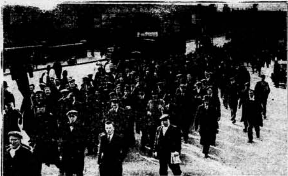
10.000 mineros de los pozos Brynlyn Seven Sisters y Brynler, cerca de Neath (Pais de Gales) se han declarado en huelga por solidaridad con 18 camaradas que permanecieron en el fondo de los pozos treinta y nueve horas, como protesta contra la actuación patronal. Los 10.000 mineros desfilando por las calles al declararse en huelga