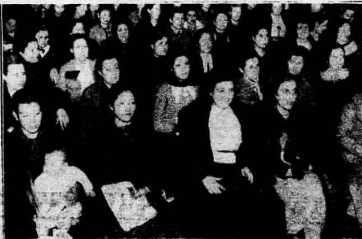
Un aspecto del Congreso Regional de «Mujeres Libres», que acaba de celebrarse en Barcelona, en medio del entusiasmo más prometedor de las mujeres antifascistas de Cataluña