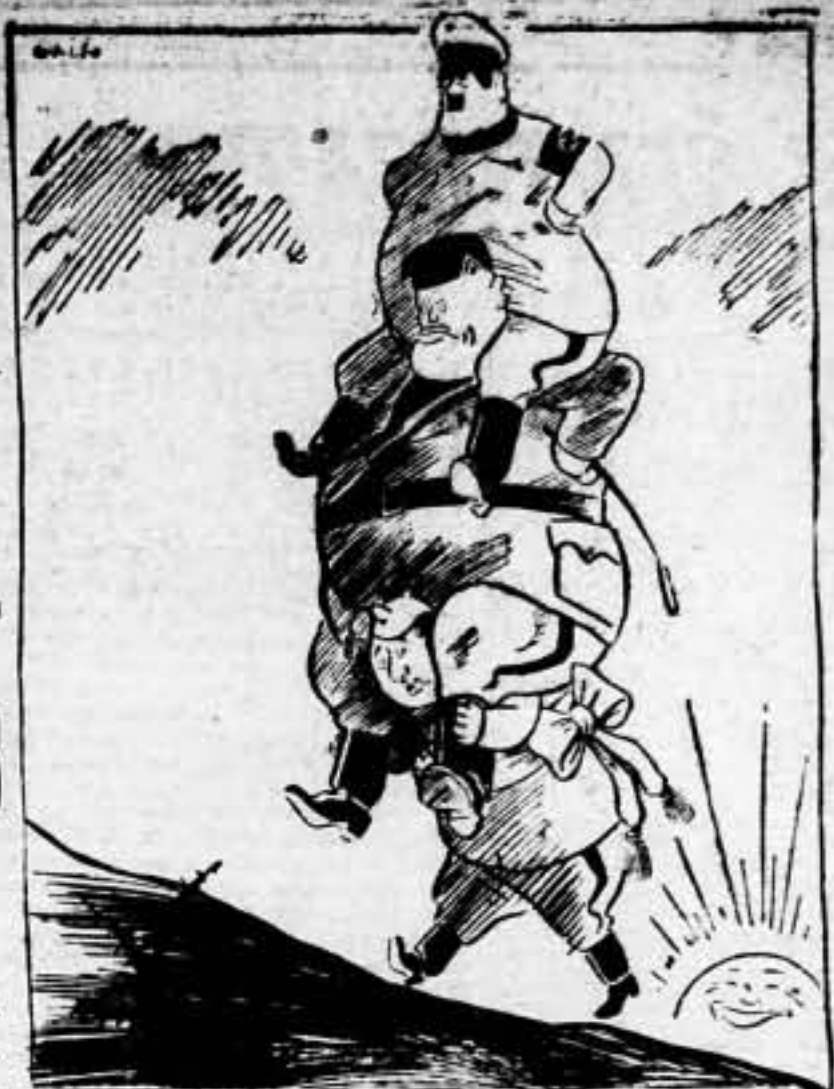
—¡Oh, desventura! Estamos a mediados de febrero, y aun continuamos en la cuesta de enero.