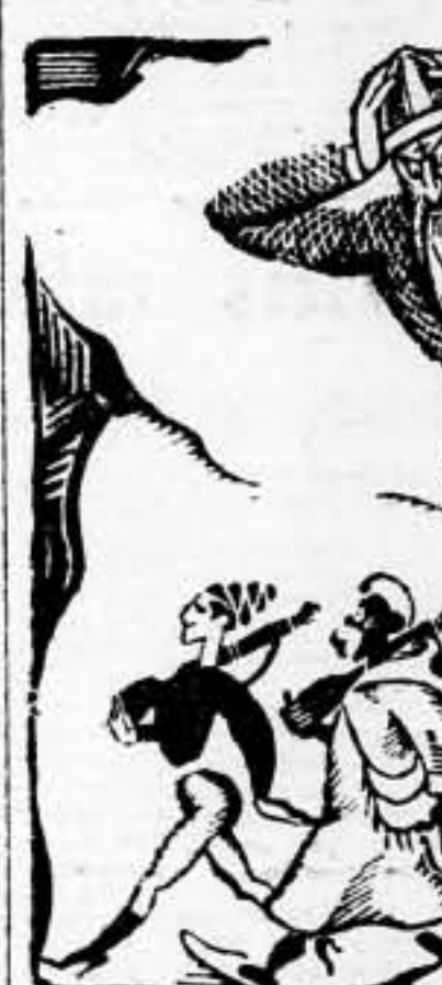
El Old Compadre: ¡Que vergüenza!