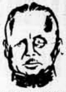
UNA AMPUTACION A CAMBIO DE UNAS CONCESIONES

En resumen, que después de los últimos emocionantes acontecimientos, se especularán las pasiones por algún tiempo, pero quedan señales de rozamientos y conflictos. La Reichswehr parece haber logrado sus aspiraciones; pero qué ha sido de las reclamaciones presentadas al "Führer" por la industria pesada y los "Junkers" con relación a la política económica de Goering? Este es un problema todavía más grave que el de la autonomía de la Reichswehr. Toda evolución de la política interior y exterior de Alemania depende, quizás, de su extensión de la política o sistema económico impuestos por Goering contra la voluntad de "chacht".