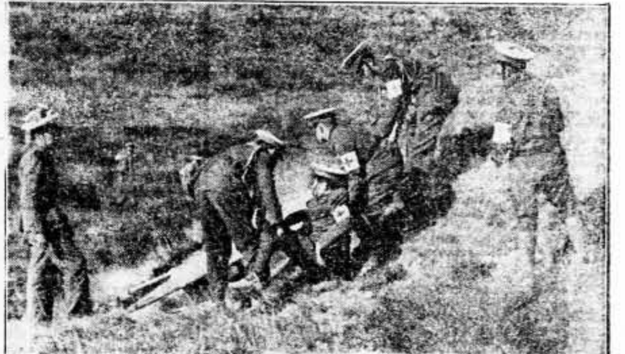
Una instantánea de las maniobras realizadas recientemente por la Cruz Roja en nuestra ciudad