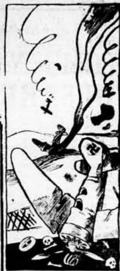
Estadísticas 1937: Sobre el campo nuestro, los de ellos