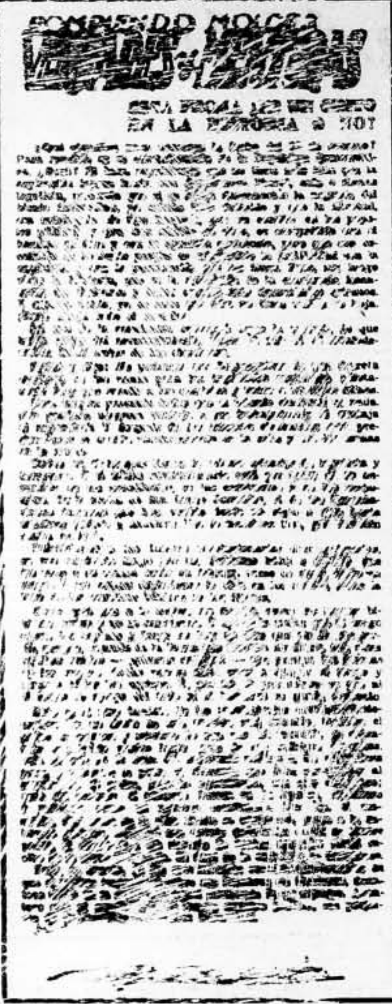
MAL TIEMPO EN TODAS PARTES