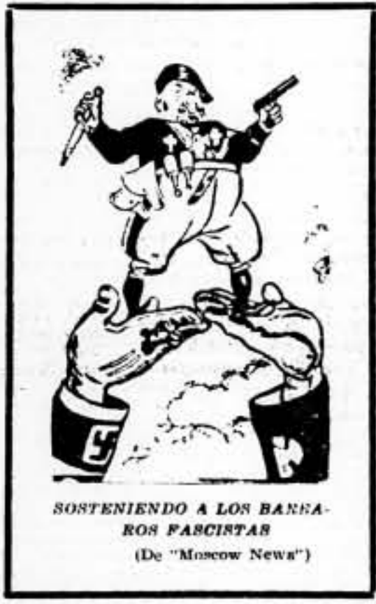
SOSTENIENDO A LOS BANANEROS FASCISTAS (De "Moscow News")