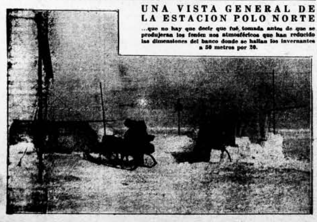
UNA VISTA GENERAL DE LA ESTACION POLO NORTE... que no hay que decir que fué tomada antes de que se produjeran los fenómenos atmosféricos que han reducido las dimensiones del banco donde se hallan los invernales a 50 metros por 20.

RUGBY. — El equipo de rugby «a 15» de Escocia venció al del País de Gales por 8 a 4.