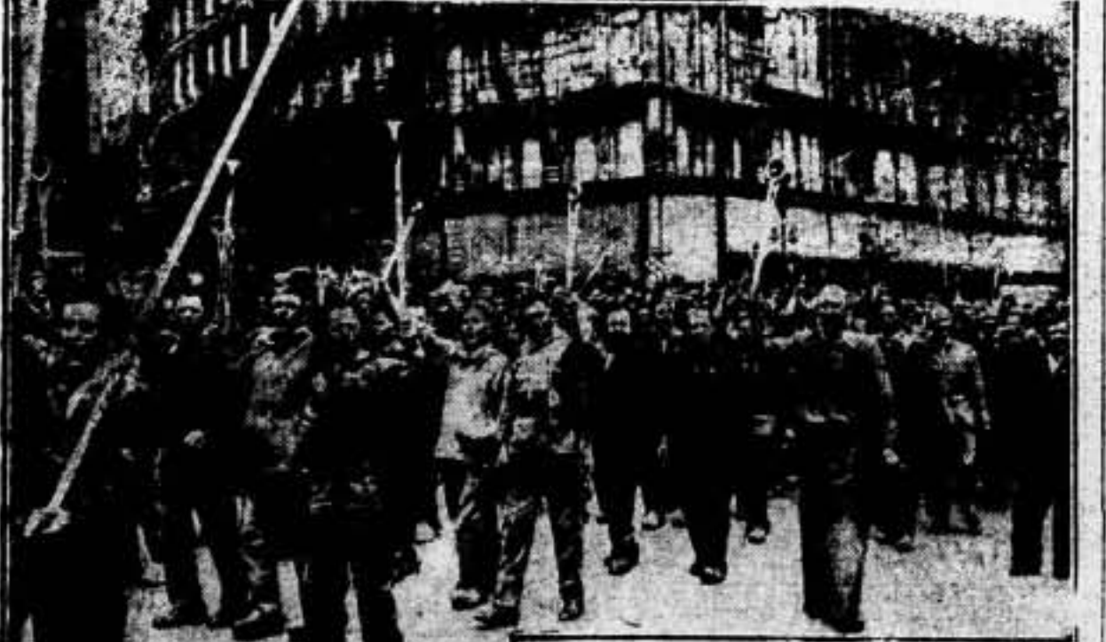
Los trabajadores metalúrgicos de Bruselas, con las herramientas en la mano, desfilan por las principales calles de la ciudad para celebrar el 50º aniversario de su organización de clase