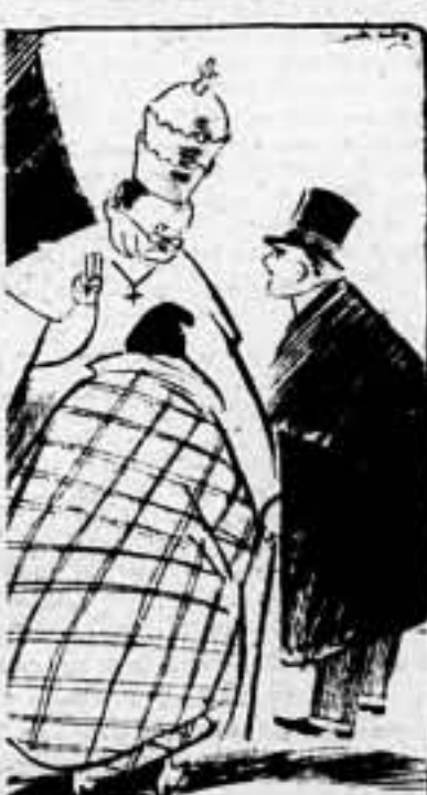
Y LAS COPAS... QUE TODO LO TAPAN.