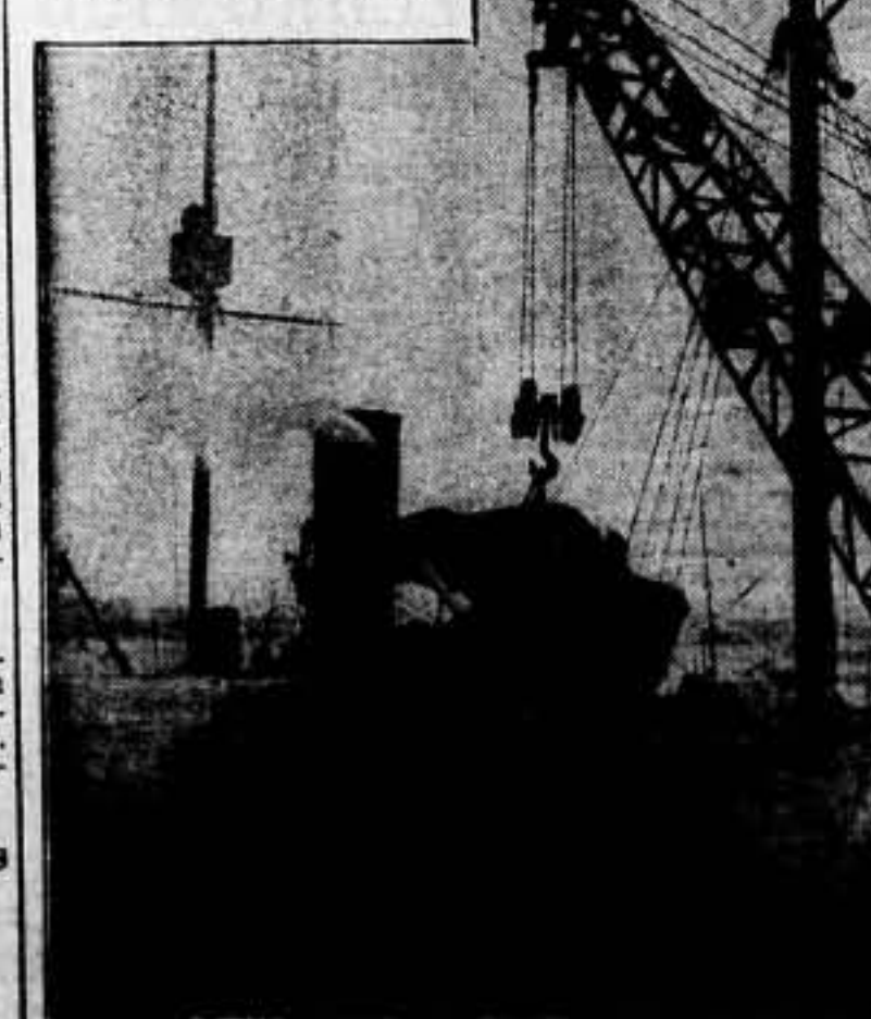
El rompehielos "Taimur" cargando a bordo un avión el servicio de la expedición de estudio al equipo Papanin