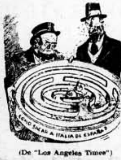
(De "Los Angeles Times")

Leed en la página 6 UN ESTUDIO GRAFICO DE LA SOCIEDAD DE NACIONES EN RELACION A LA POLITICA MUNDIAL.