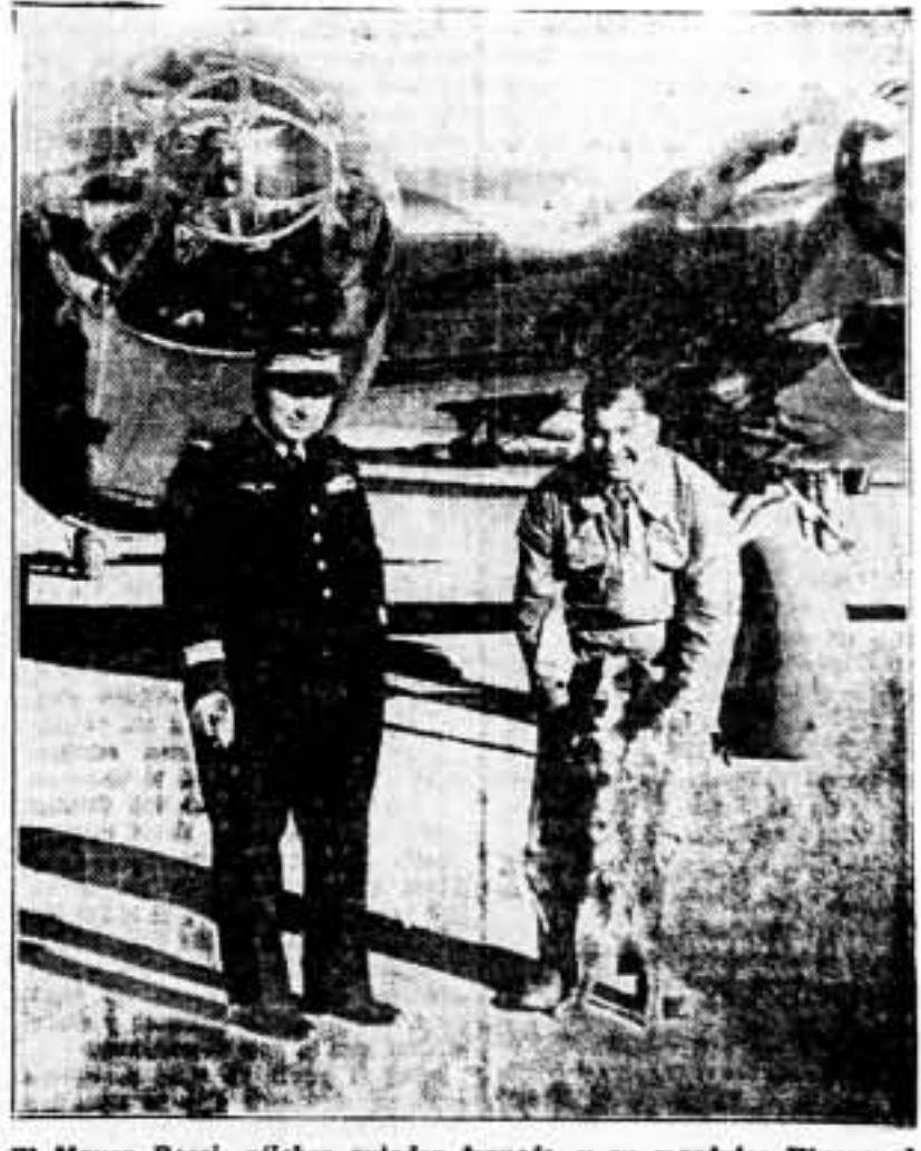
El Mayor Rossi celebra aviador francés, y su mecánico Vigoreux, acaban de batir el "record" mundial de velocidad, llevando una carga de dos toneladas sobre una distancia de 2.000 kilómetros. El vuelo efectuado fué de Argel a Orán en cuatro horas, treinta y cuatro minutos, o sea a una velocidad media de 243 kilómetros por hora.