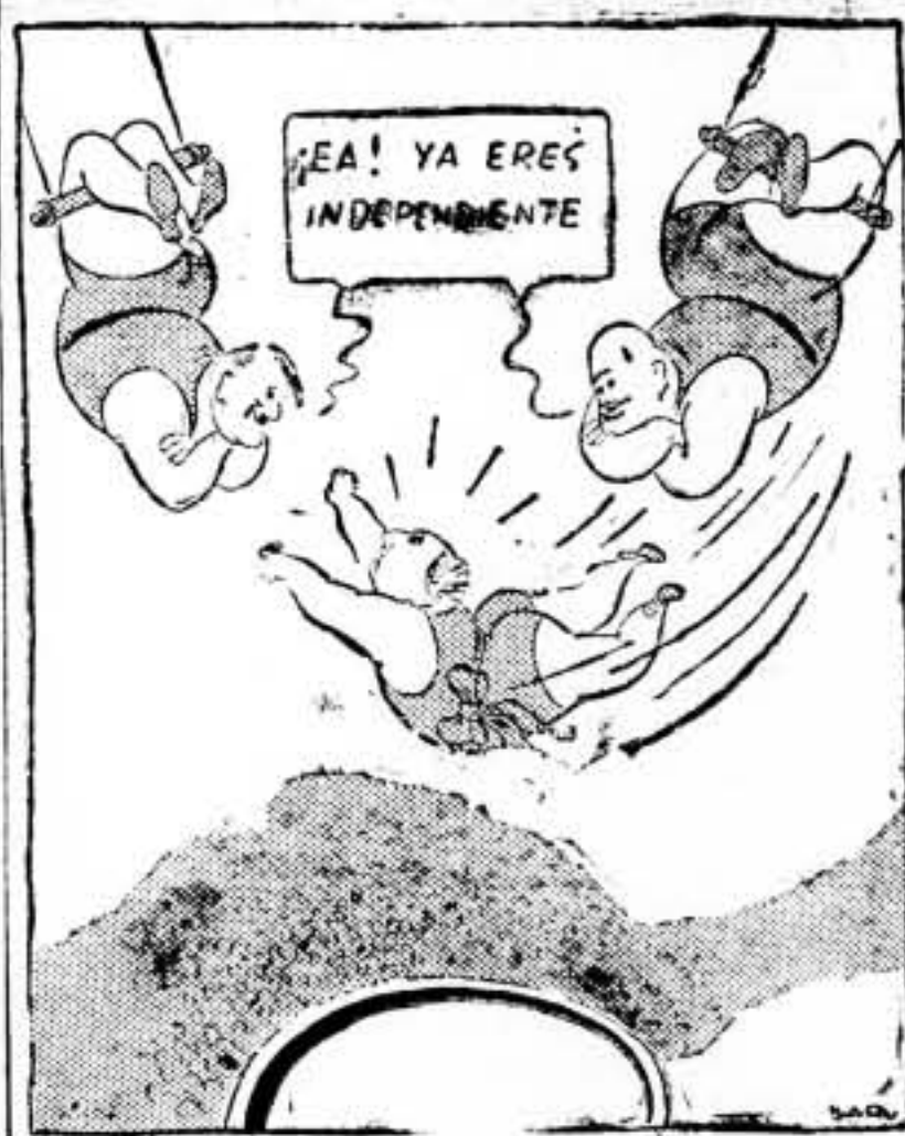
La actitud que tendrían que adoptar si tuvieran palabra de caballeros

"Alemania e Italia garantizarán la independencia de la España nacionalista."