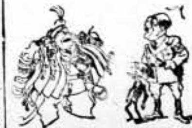
Goering.—Y ¿qué? ¡Cinco funciones, pues cinco uniformes! (De "L'Humanité")

GOERING ASUME LAS FUNCIONES DE MINISTRO DE LA GUERRA, DE MINISTRO DEL AIRE, DE PRESIDENTE DEL REICHSSTAG, DE PRESIDENTE DEL PLAN Y DE MINISTRO PARA EL PLAN DE LOS CUATRO AÑOS. (De las periódicos.)