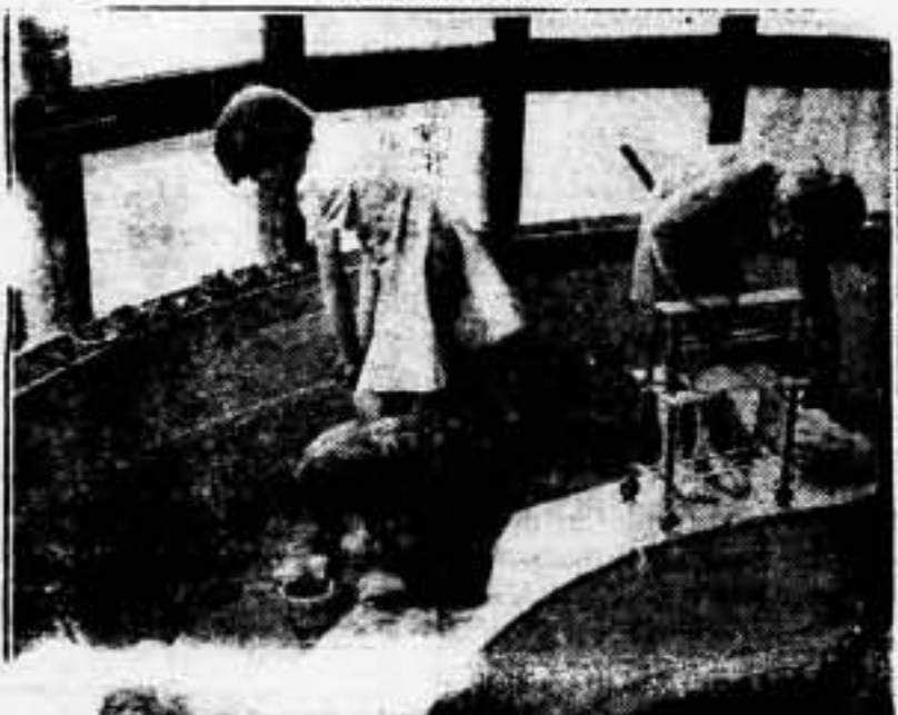
La nueva escuela-guardería Hampden, situada en Holland Park de Londres, se desarrollará bajo un nuevo sistema de educación en comunidad y cooperación entre los 22 alumnos que actualmente tiene pudiendo los pequeños hacer intercambio de juguetes y animales, que traen de sus respectivas casas. Un aspecto de los niños jugando en la arena.