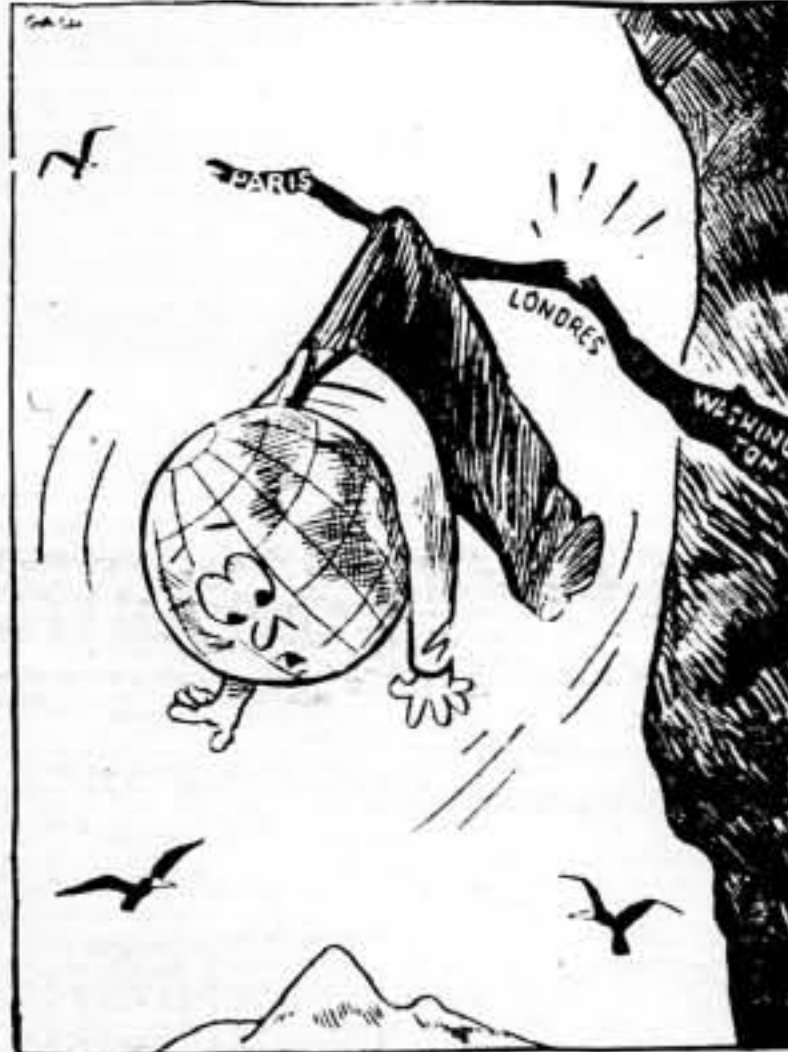
SOBRE EL ABISMO