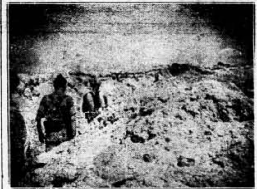
Nuestras trincheras de avanzada en la Ciudad Universitaria