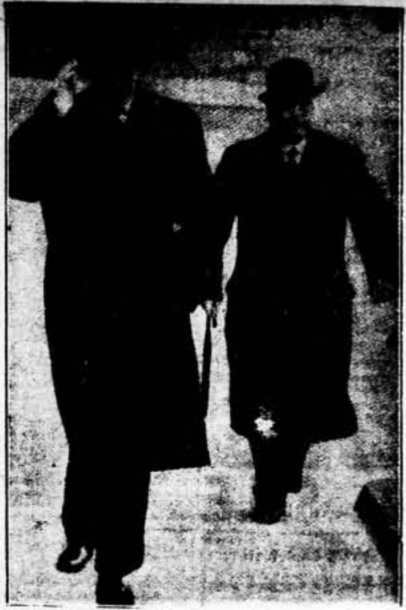
El señor Edén sintiendo de la Cámara de los Comunes, después de haber pronunciado su discurso, que tanta resonancia ha tenido.