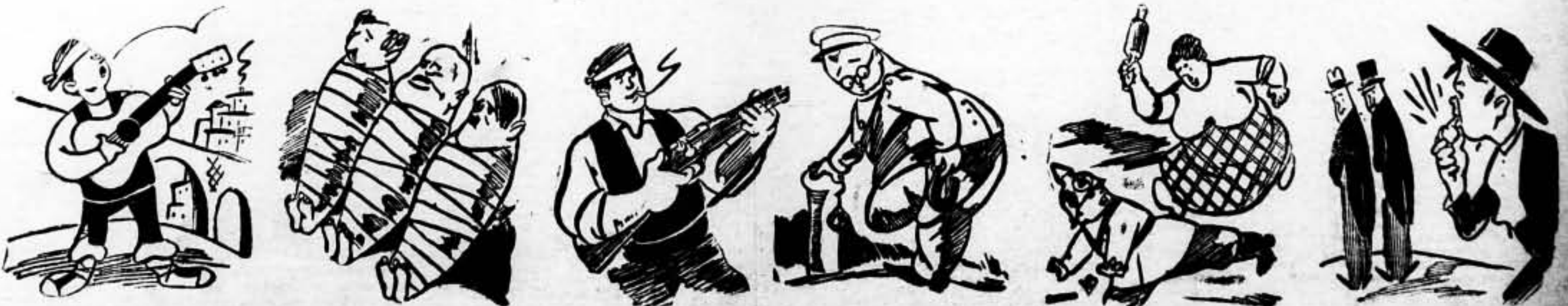
Contra un mallo aquella jota a las puertas de Teruel. «No te apures si me marchó, que muy pronto he de volver.»