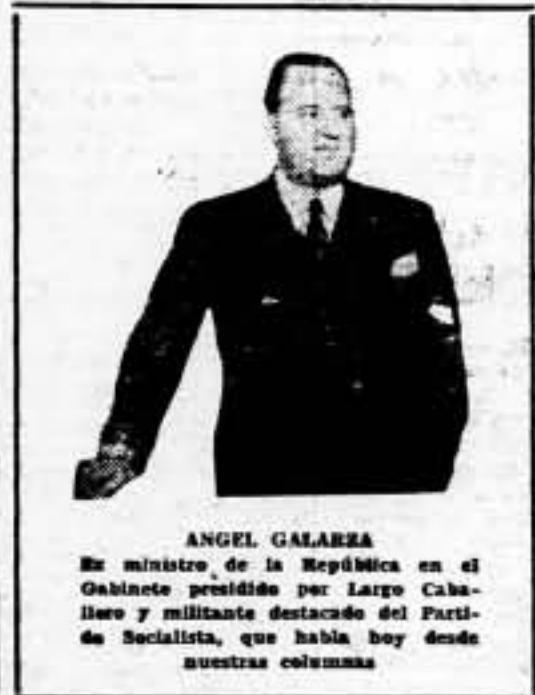
ANGEL GALARZA Es ministro de la República en el Gabinete presidido por Largo Caballero y militante destacado del Partido de Socialista, que habla hoy desde nuestras columnas

—Las bases de la C. N. T. me parecen apropiadas para iniciar las conversaciones de Alianza. Yo sé — quizá como nadie — lo que la C. N. T. ha hecho en la guerra y en la Revolución; sus aciertos y sus errores; lo que a su sombra se hizo y lo que quiso hacer... y también lo que se le imputó, y lo que se hubiera querido que hiciera. Perteneciendo a la otra Sindical cuyos desvelos, sacrificios, aciertos y errores no han sido menores. La alianza — que no unidad — me parece sencilla. Sólo podría fracasar si cualquiera de las partes llevase el propósito en los labios y no en el corazón.