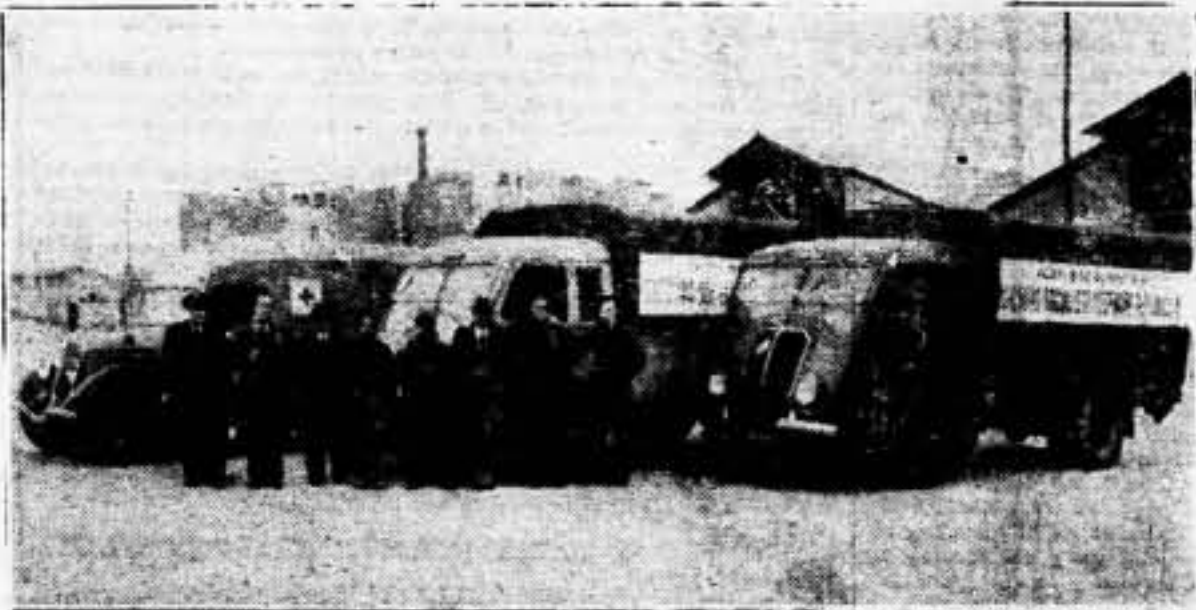
El Partido Socialista francés, S. F. I. O., ha enviado a la España leal cuatro camiones de víveres y una ambulancia sanitaria, todo ello destinado a nuestro glorioso Ejército Popular.