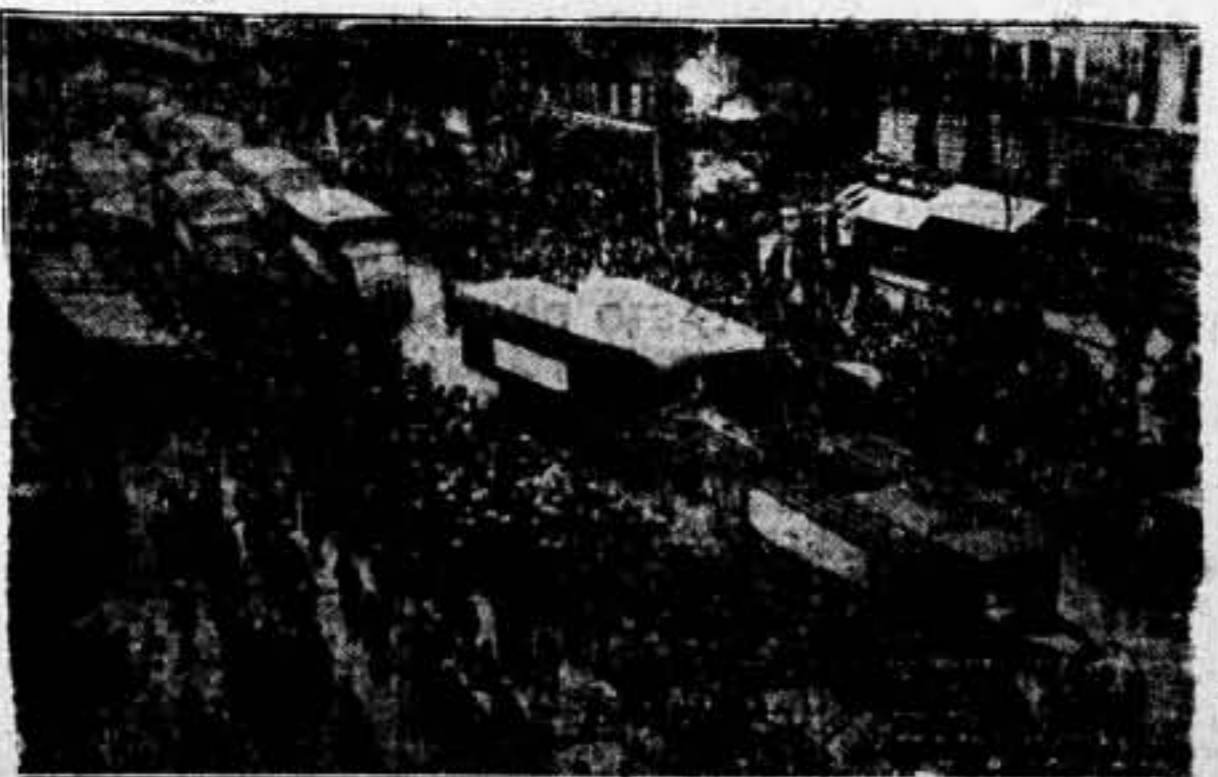
Los obreros parisienses responden al último ataque capitalista contra la Revolución española, enviando 38 camiones de víveres, de bales de leche y ropas. Los camiones desfilan por las calles de la capital de Francia, antes de emprender su viaje hacia España.