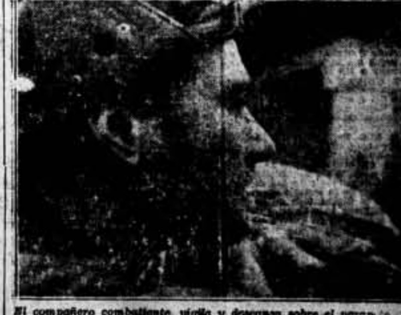
El compañero combatiente, vigilante y desconfiado sobre el parapeto, ve el destino y la voluntad de su ejército.