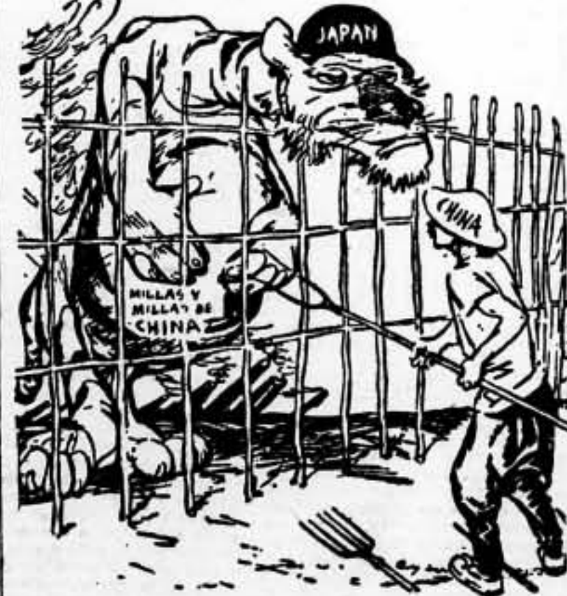
EL JAPON PIDE UNA TREGUA

—¡Dejemos de pelear mientras digiero lo que se ha comido!