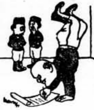
—Se ha decidido a ser soldado poeta.— (De "L'Oeuvre")