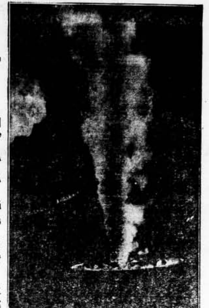
Quando el pasado domingo comenzó a circular por nuestra ciudad la noticia de que el crucero pirata "Balearis" había sido hundido por la flota local, los elementos facciosos incrustados en nuestra retaguardia iniciaron una campaña tendente a contagiar de escepticismo a la población. Como prueba concluyente de la noticia hecha circular por el Ministerio de Defensa Nacional, ofrecemos a nuestros lectores esta vista del crucero "Balearis" ardiendo en alta mar, tomada desde un avión.

En síntesis, el señor Delbos ha dicho: «Para Briand, que consideraba la paz asegurada como un estado normal de la humanidad, la Sociedad de Naciones era en cierta manera el elemento natural de su actividad... Nadie mejor que él, en efecto, comprendió una verdad tan ignorada en nuestros tiempos como es: Europa debe unirse, o perecer; perturbado su equilibrio, se precipita su destrucción. En medio de las dificultades y amenazas por que atraviesa Europa, el ejemplo de Briand debe inspirarnos. El nos enseña simultáneamente, un alto ideal y un elevado deber: el de organizar todas las fuerzas que pueden defender el ideal de la paz. En primer lugar deben organizarse las fuerzas que son necesarias para la salvación de la patria, para la defensa de sus intereses y para el cumplimiento de sus deberes. Francia, siempre fiel a este ideal de solidaridad humana y de seguridad nacional, no olvidará jamás las palabras del gran hombre que desapareció de entre nosotros para siempre. — Fabra.