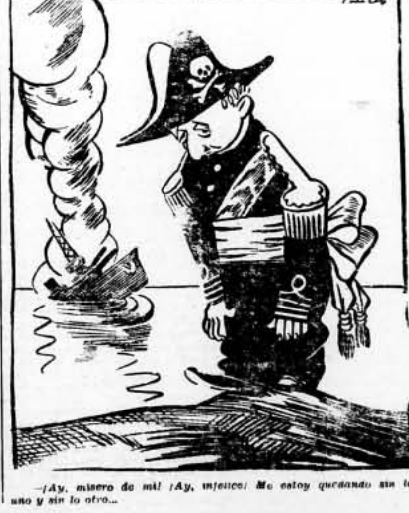
¡Ay, misero de mí! ¡Ay, infeliz! Me estoy quedando sin trabajo y sin lo otro...

Gibraltar, 7. — El crucero «Dorsetshire», llevando a bordo el segundo batallón del regimiento del Rey, ha llegado hoy procedente de Southampton. El batallón será mañana relevado por el batallón del regimiento de infantería ligera de Yorkshire. — Fabra