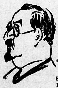
SERVICIO EXCLUSIVO DE "SOLIDARIDAD OBRERA"