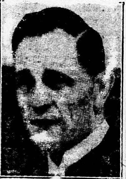
Servicio exclusivo de SOLIDARIDAD OBRERA