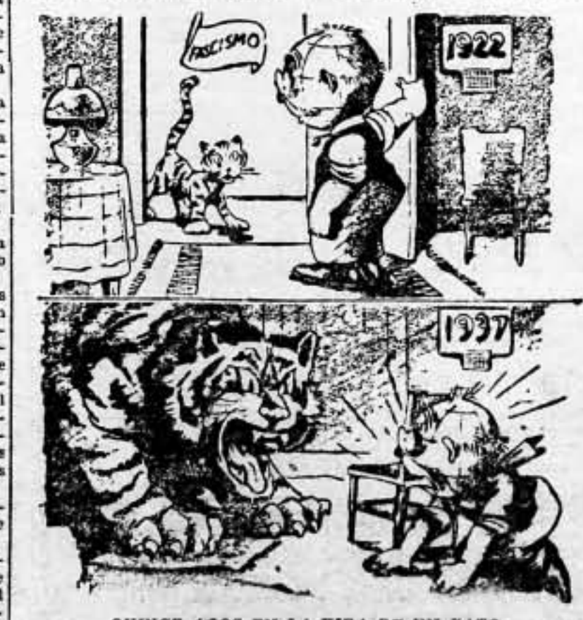
QUINCE AÑOS EN LA VIDA DE UN GATO (De "The Washington Post")