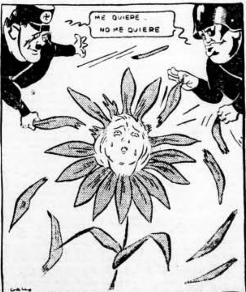
CARISOS QUE MATAN