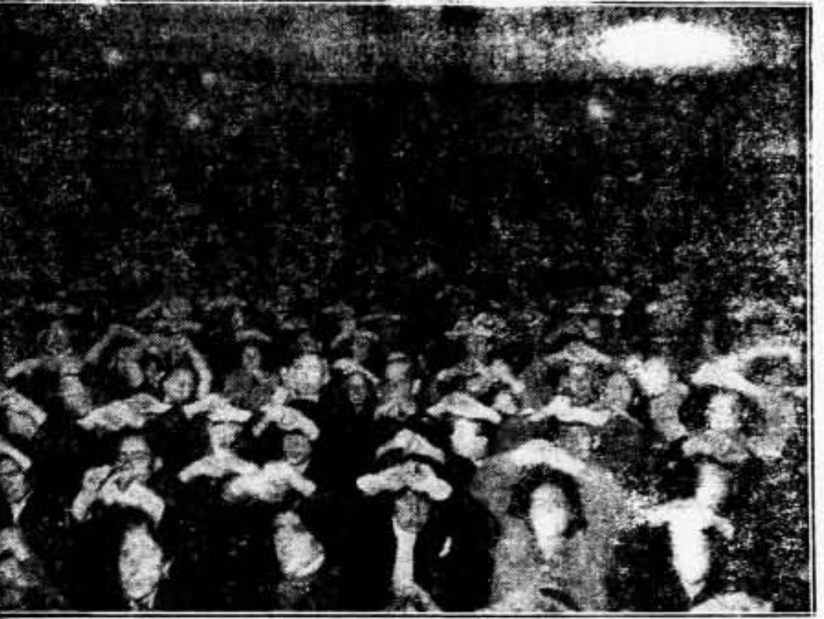
El día 8 del presente se ha celebrado en Madrid un gran mitin de la F. A. I. en el Monumental Cuadra. Una vista del local durante la celebración del acto