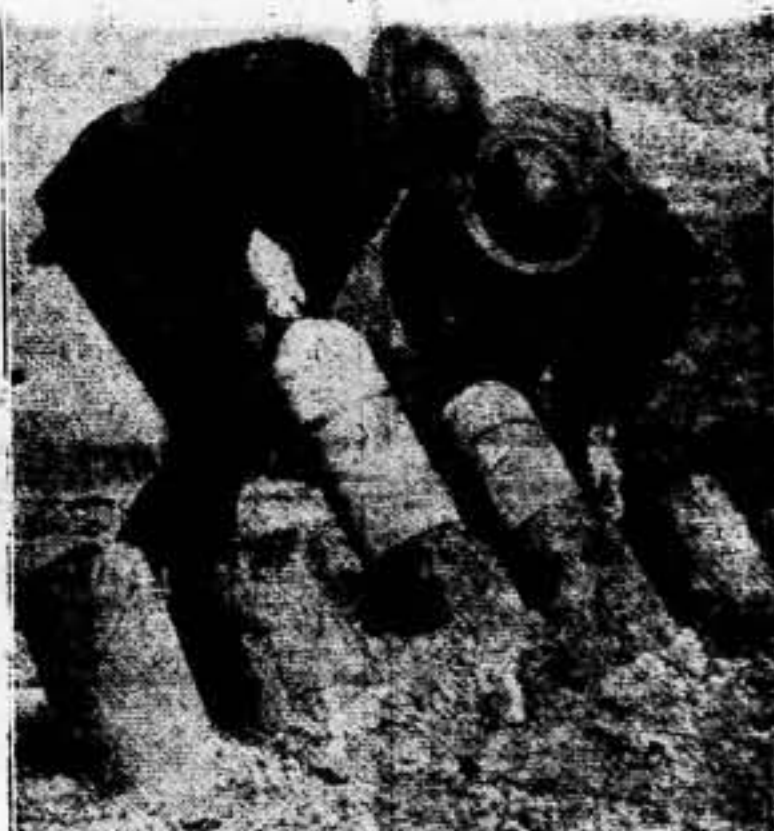
Oficiales del ejército norteamericano practicando en Edgewood, Md. el nuevo proyector Lívens capaz de lanzar a una distancia de 1.500 yardas bolas de sesenta libras, cargadas de gases mortíferos. Estos oficiales regresarán después a sus unidades como instructores en la moderna guerra química.