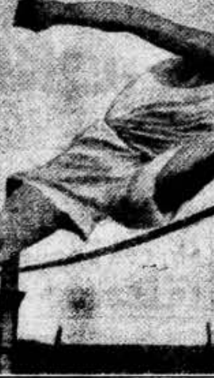
B. H. Ploydell, ganó el concurso featural de la Universidad de Cambridge, saltando 5 pies y 9 pulgadas...