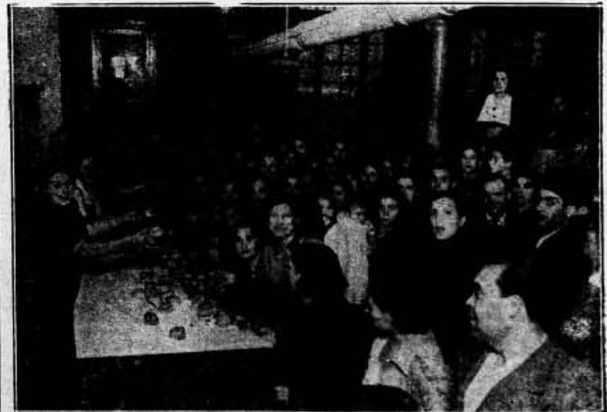
Los trabajadoras C. N. T. y U. G. T. de la Fábrica Rafel, son obsequiadas con un refrigerio por la acción de tres entusiastas camaradas, a cuyo celo debe la guardería que ha sido inaugurada en un momento de mayor entusiasmo

Todo esto —más diríamos si pudiéramos— es cuanto tenemos que decir a nuestros camaradas. Contra el regocijo del hipócrita, la acción férrea del antifascista sincero.