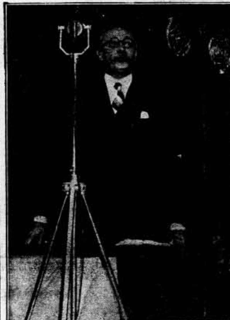
Después de haber constituido el nuevo Gabinete, Leon Blum se ha dirigido al pueblo francés por medio de las emisoras, lanzando un emocionante llamamiento a fin de que todos colaboren con él en la difícil etapa política que atraviesa hoy Francia