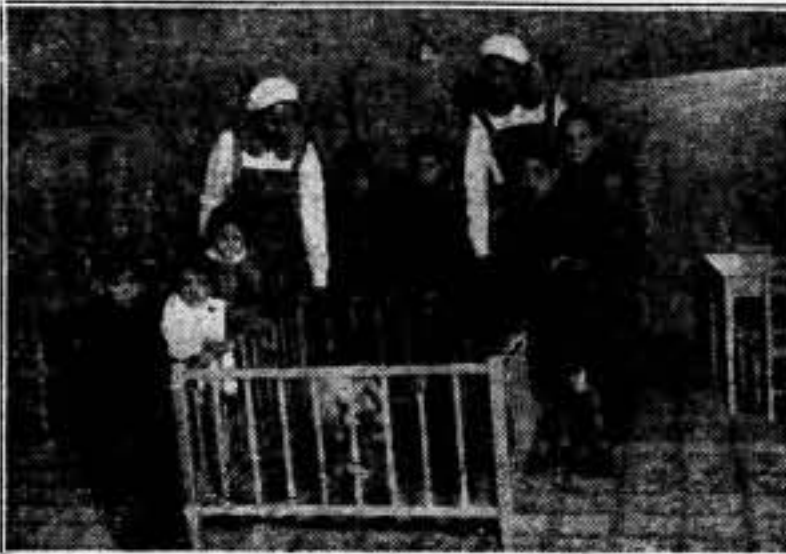
Un aspecto de la guardería que los trabajadoras de la fábrica de generadores de punto, Rafel, E. C., han creado con su propio esfuerzo, obra modelo que presentamos como ejemplo a todas las demás

Volvieron aún más capitalistas que se habían ido, y más asustados de la revolución que nunca. Miraban con horror y terror la consolidación del Gobierno socialista. Propusieron impedir transacciones y retos, y por eso ayudaron a Alemania a levantarse. Era una fuerte barrera contra el comunismo ruso. Por la misma razón entregaron a Mussolini Adria (Pasa a la página 4)