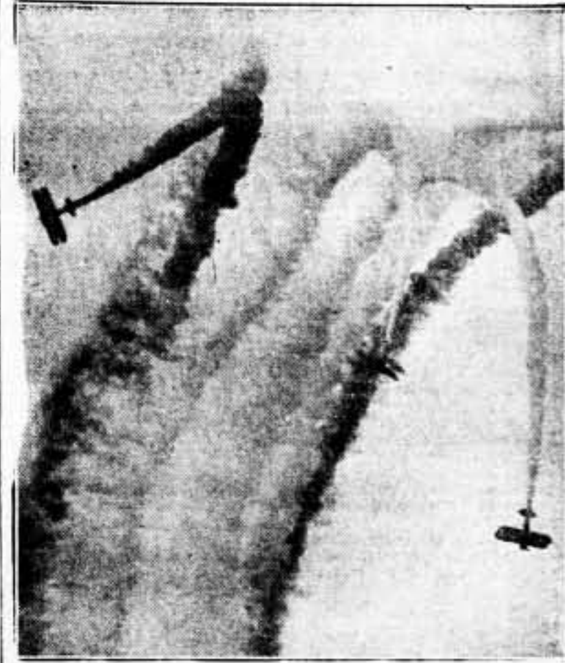
Hemos acertado con los tres. El frente de Aragón —pródiga cosecha de aviones enemigos— ha permitido esta foto reciente de tres aparatos tendidos por nuestros cañes.

SO ORGANO DE Barcelona iiA POL YA L A gu an con cre ció en p tiéndolo en c a la impotenc decimos con se ve asistid victoria. Arn ficio, valentí segundo, a co vigor el Pact fortificación Es en temple de los cumplimiento cumpliment en todas par dial de cuan ducir. Traba cobardes o d cueste lo que Pelaez apoyo decis narse porqu sea un temp discursos y los trabajado Ni lo han co Ni lo han o de nuestros es algo inco mundo prob instante en los obreros asesinos ven trabajadora precisamen ¡Ad resistencia la frente y los que ha costa de to ¡LOS MO L A p pro bles con alemana las dem mintru en Espa Barcelona repudio conserva Francia. Se 105 Gob tes en l los hom didas se minimo on has Dej crea fientem de defe legar l presa meda ante la y elen podimo obrar s del ene recho, e del fas El mer puesto plia fr