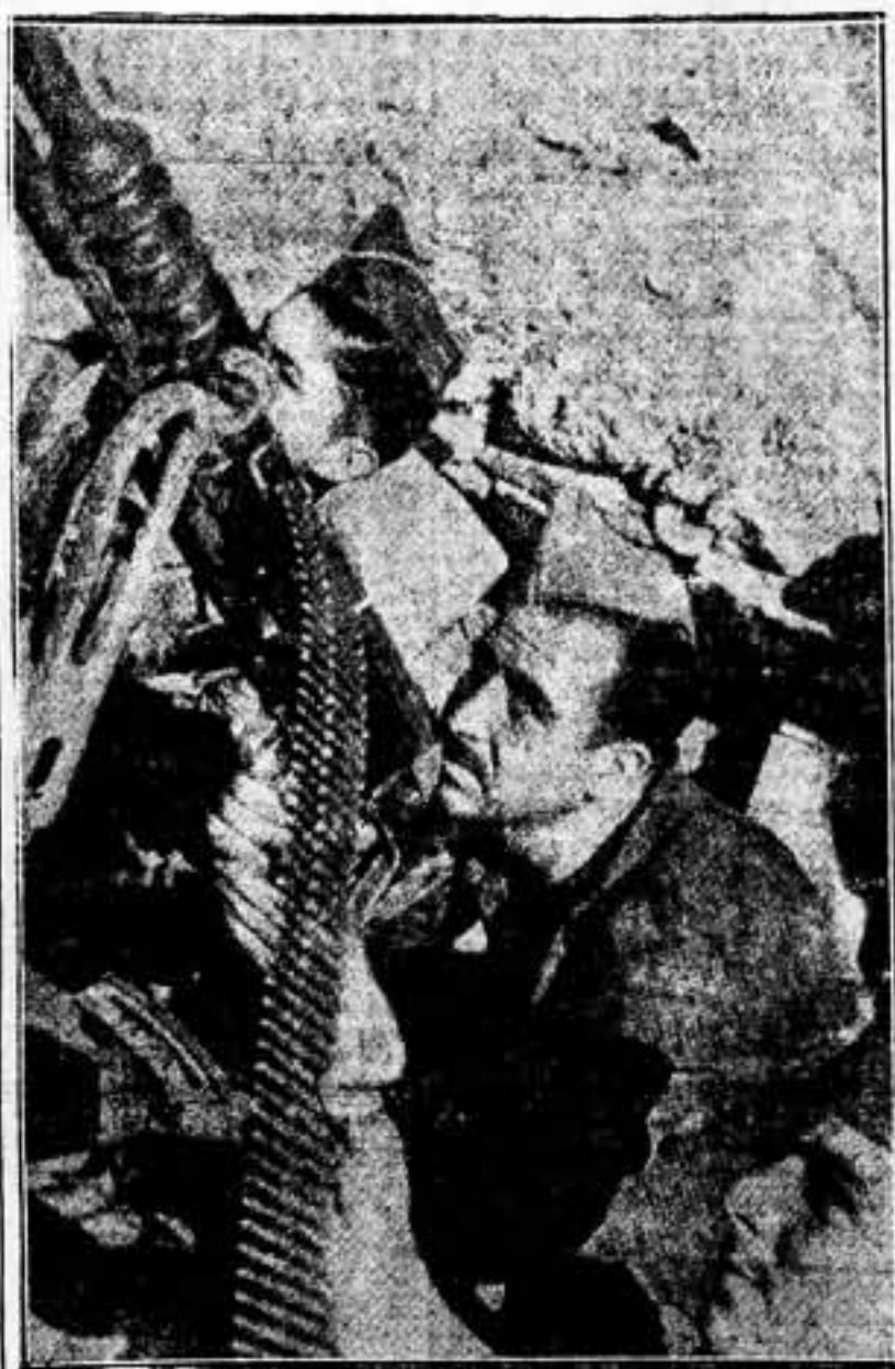
Integro del pueblo asesinado por la cobarde agresión fascista, es la ametralladora antiaérea, cuyo dispositivo luminoso permite rectificar el tiro durante los ataques nocturnos. Tal como este soldado, con la vista fija en el enemigo, deben actuar todos los antifascistas de esta hora.

¡POR ENCIMA DE LA BARBARIE Y DEL TERROR TOTALITARIO, ADELANTE!!