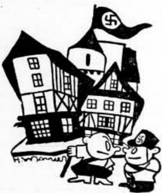
—Nosotros no dejaremos atropellar el derecho de unos pueblos a invadir a los demás.

Por otra parte, la brutal arrogancia del comunicado oficial que daba cuenta de la visita de Franco-Poncet a la Wilhelmstrasse y que calificaba esta visita de «inadmisible», ha producido un pésimo efecto que compromete el porvenir de las relaciones entre Berlín, París y Londres.