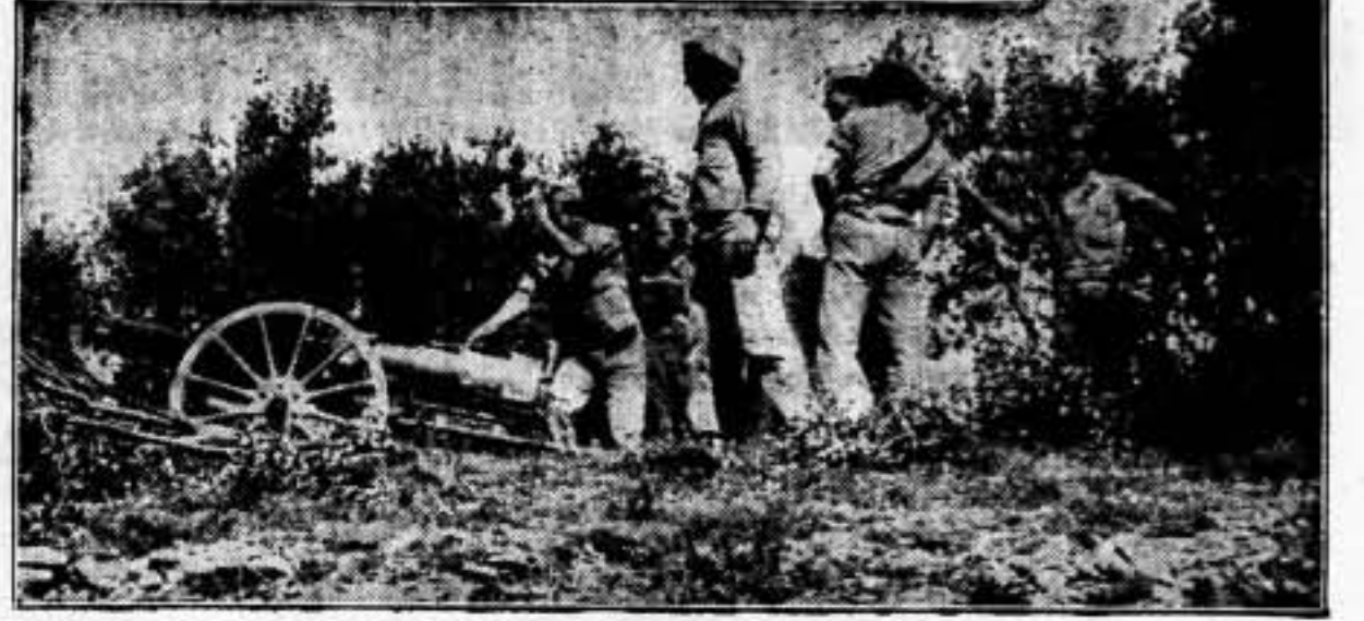
CUMPLIMIENTO DEL PACTO C. N. T. - U. G. T.