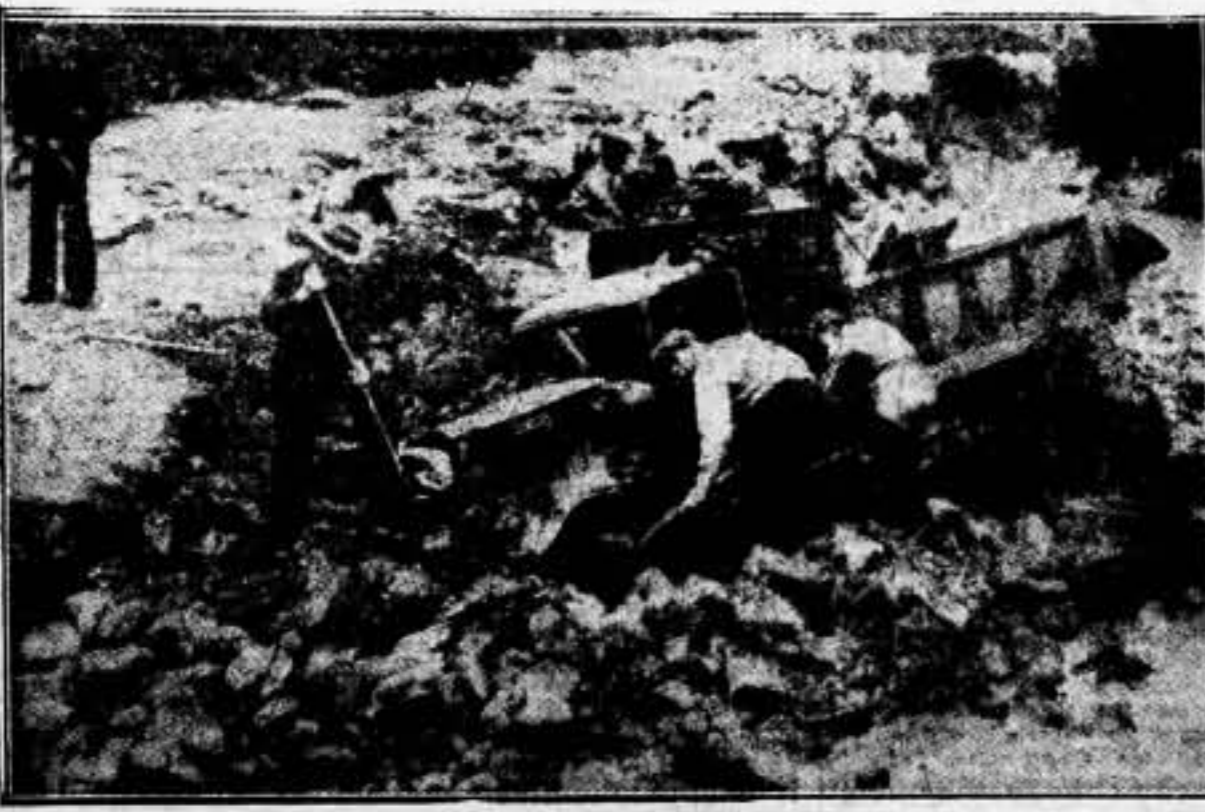
Obreros entregando un camión atascado en el barro en un campo de California, a consecuencia de las lluvias torrenciales, que causaron graves inundaciones e inmensas pérdidas materiales en todo el país. El número de víctimas también es muy crecido

El puesto de trabajo es una trinchera. La herramienta del trabajo es como un fusil. La hora del trabajo es, como la de la trinchera, hora de sacrificio y de honor. ¡Que nadie falte a su puesto! ¡Que todos los obreros de Barcelona sean dignos de la grandeza de estos instantes únicos!