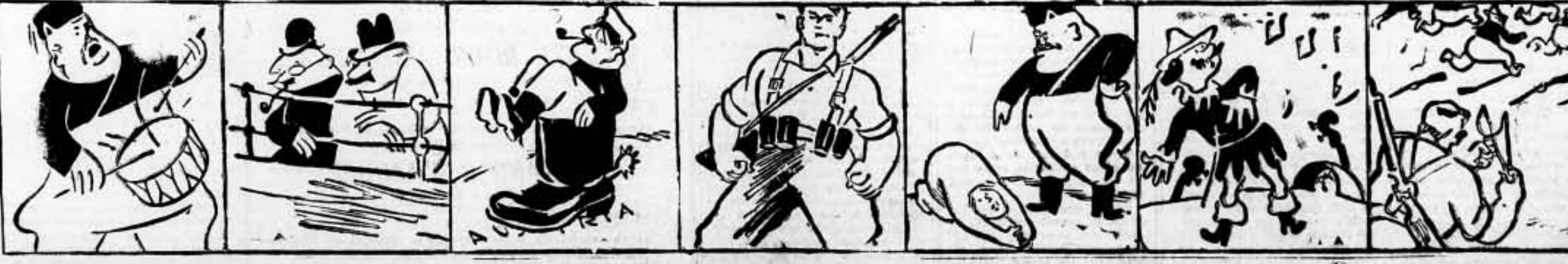
I Anuncia a tambor batiente... que ha enviado a España peste. II Por la democracia espera toros desde la barrera. III Y de Hitler la imprudencia ven con toda indiferencia. IV Se resiste bajo el sol tan alto Juan Español. V Esclavo de un tirano menos será el pu... Magana. VI Que un país de tamarinos se registró sus delitos. VII Final para estas ciferas: ¡Vengan todos a hacer... pape...