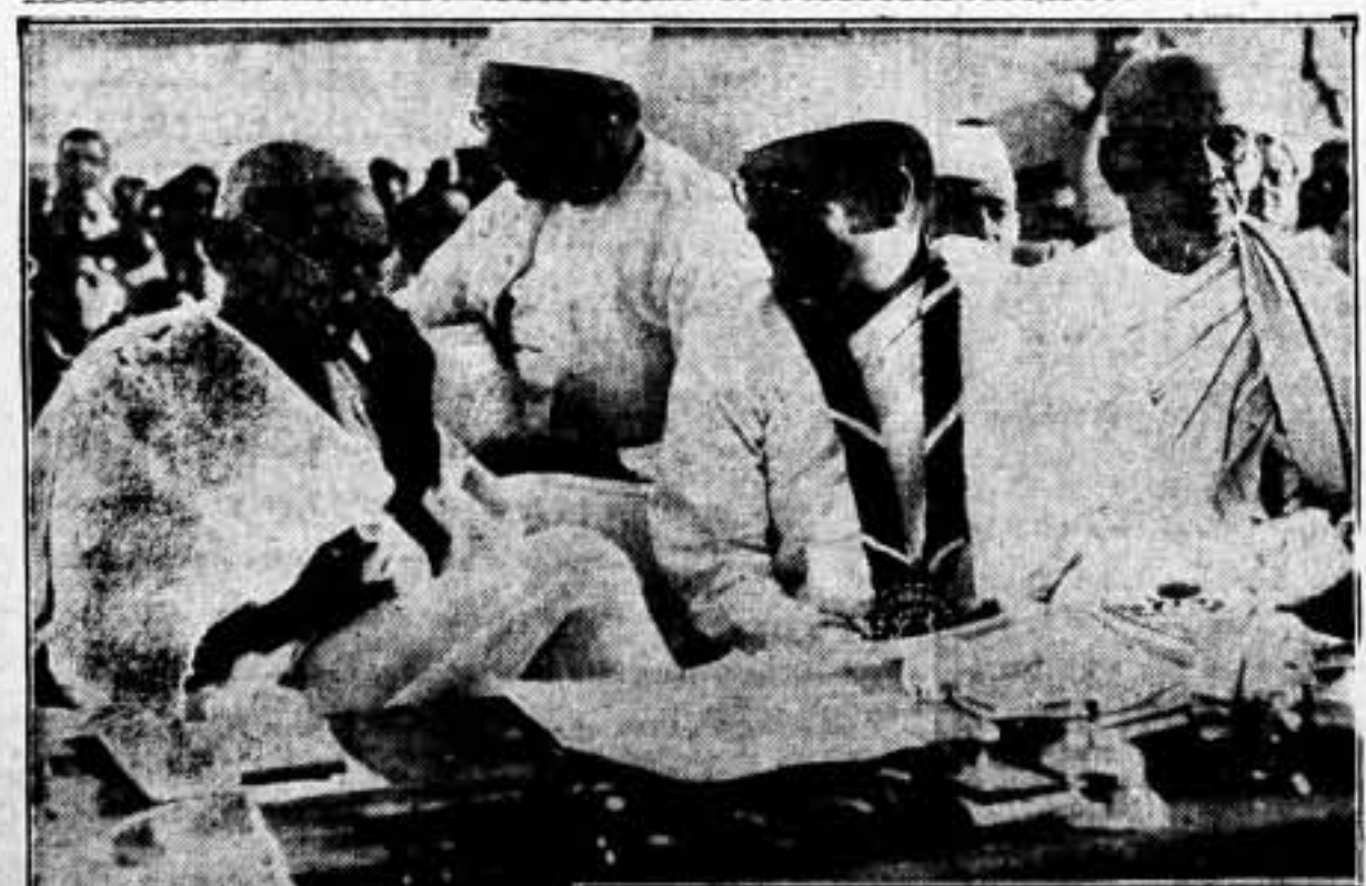
GANDHI ADMITE BROMAS

Berlín, 18. — Varios periódicos extranjeros, entre ellos el "The Times", el "Daily Telegraph" y "Le Jour", han sido recogidos esta mañana por la Policía. — Telexpress