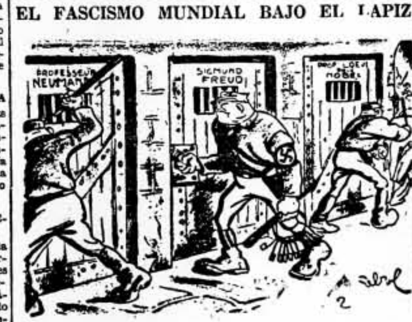
...Han pasado los bárbaros (De "L'Humanité")

Londres, 21. — La prensa continúa comentando la situación en que se encuentra Chamberlain. E lequedado escribe que Chamberlain en los próximos días impondrá su política a Inglaterra y tendrá que marcharse. Los propios partidarios están alarmados y furiosos. Muchos de ellos creen que Chamberlain ha perdido completamente el control de los asuntos extranjeros.