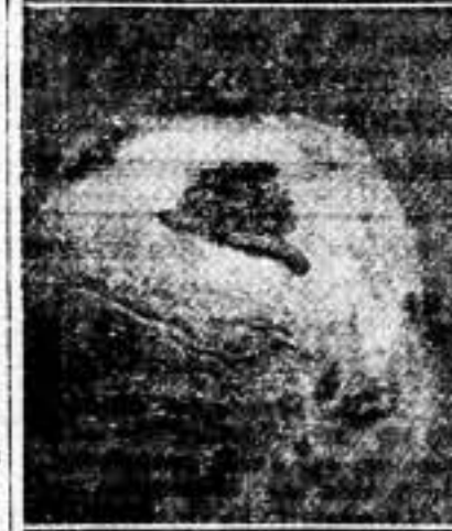
Larvas de la "polilla", sobre un tubérculo, con las defecaciones de la hembra una de las galerías

centímetro de longitud, aproximadamente y es de color amarillito sucio, con la cabeza y patas pardoscuras.