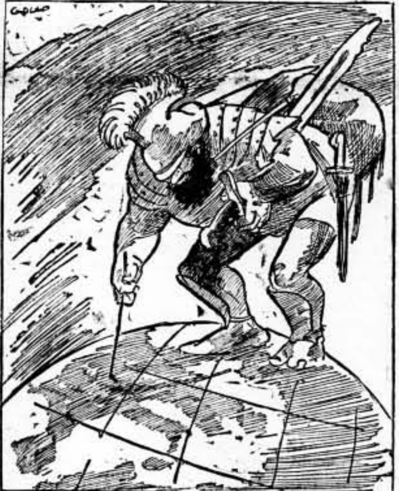
Marte busca el Sarajevo 1938