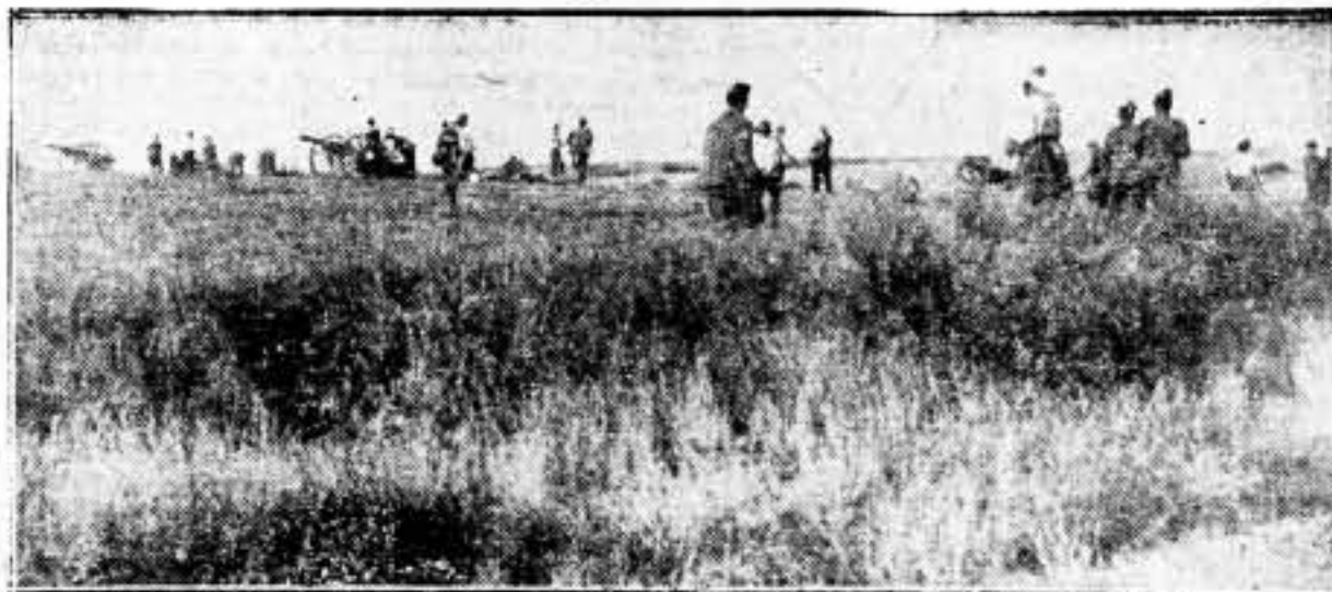
Sobre el llano, los cañones levantan sus bocas al espacio. Son como los brazos de Agar, invocando, en la elevación, la justicia reprobadora contra los traidores de nuestra España libre, sobre los que ha caído la maldición de todos los países dignos