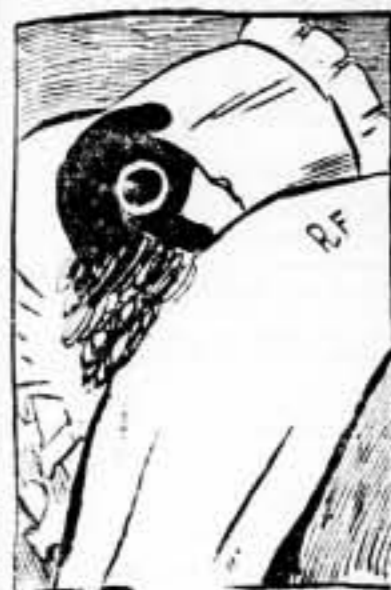
LA BELL... PASSE...