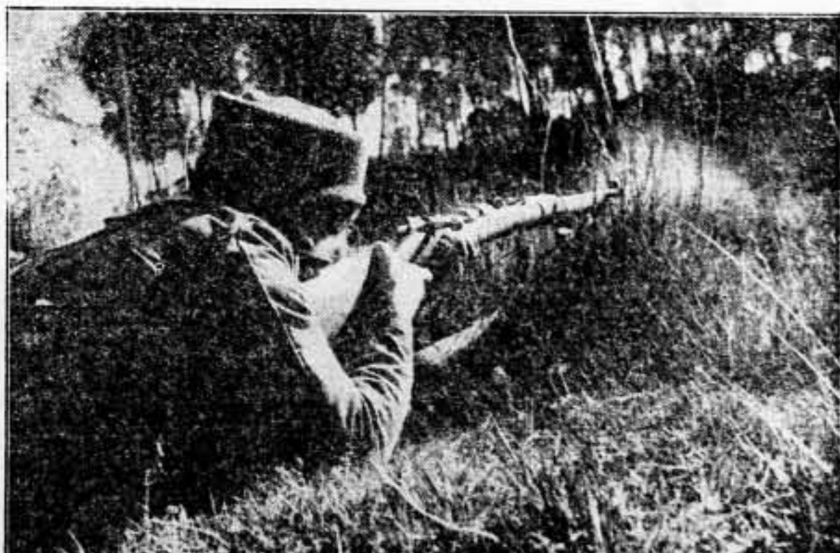
En esta imagen debemos tener puesta la imaginación todos los antifascistas de la retaguardia.