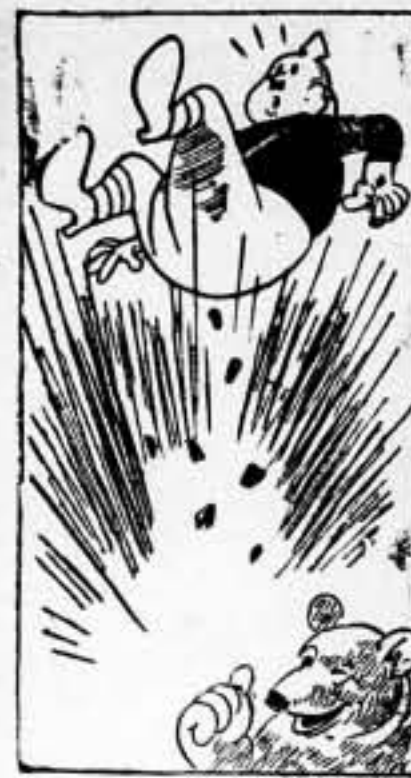
DE MADRID AL CIELO...