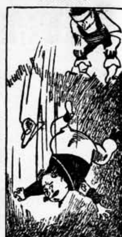
...Y DE ARAGON AL INFIERNO