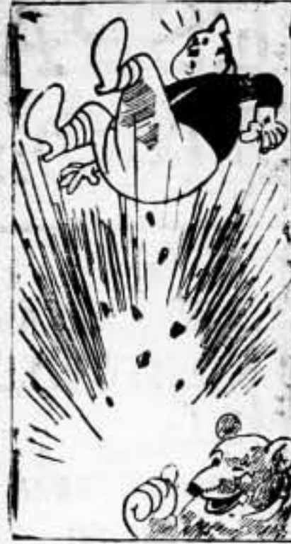
DE MADRID AL CIELO