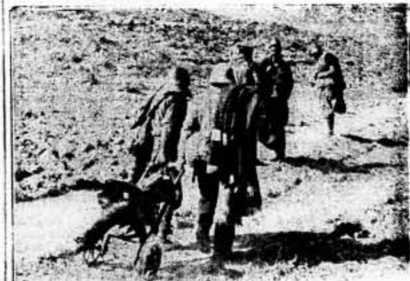
En el avance, la ametralladora es lo primero que hay que trasladar. Es ésta el arma que consolida más y mejor las nuevas posiciones conquistadas.

LA LUCHA EN LOS SECTORES DEL ESTE Las tropas leales de Levante, avanzaron, rebasando Terriente en la parte de Barbastro, el enemigo consiguió adelantar su línea. = Nosotros ocupamos Masegoso Leed en la página 2: