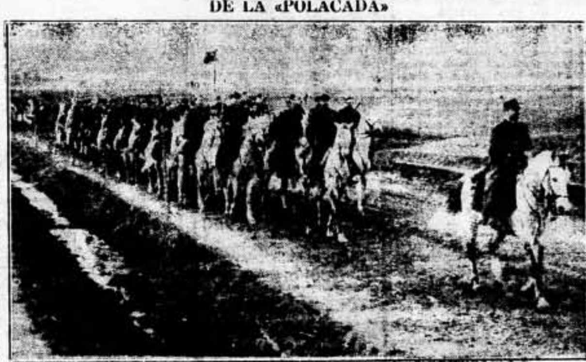
Esta primera fotografía del conflicto polaco-húngaro representa la caballería húngara cerca de la frontera de ambos países, regresando al campamento de ser aceptado al ultimátum y sin haberse empleado lo más mínimo en ninguna acción de guerra.

Todavía no es demasiado tarde. Hay que avanzar contra el fascismo, imponerle un "basta". He aquí cómo salvar la paz, cómo evitar un desastre irreparable.