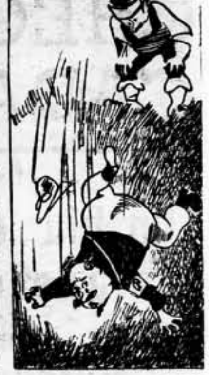
Y DE ARAGON AL INFIERNO