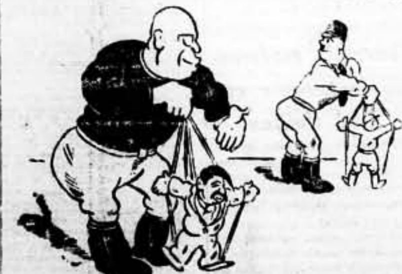
UN JUEGO QUE ESTA DE MODA. MENITO: "Yo también tengo mi Selta Inguart..." (De "Le Populaire")

Desde el día 28 de agosto de 1934 fecha en la que marchó al Frente, como voluntario, ha luchado con tra al enemigo en primera línea.