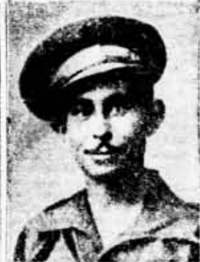
Teniente comandante del 497 Batallón 125 Brigada mixta, 28 División, muerto en Carballán el 31 de febrero de 1938.

A resultas de una demanda de empujamiento de Negocios de Méjico las autoridades cubanas han autorizado la salida bajo el mando de pilotos de la Marina mejicana. — Telexpress