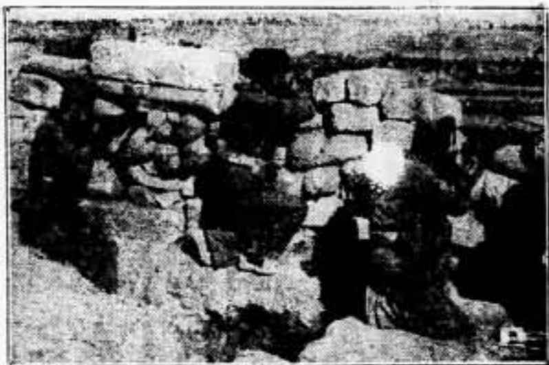
Cara al sol "sin la camisa nueva", porque estos hombres pelean en vanguardia defendiendo los parapetos de la democracia mundial, días y días, sobre el seco aragonés.