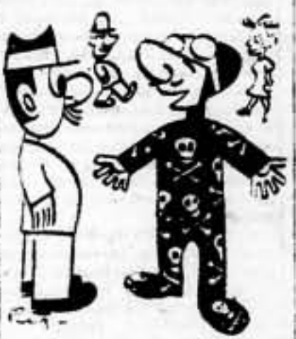
¿Que le parece mi disfraz de aviador franquista? (De "L'Oeuvre")

Por el Comité Regional de Cataluña. El Secretario