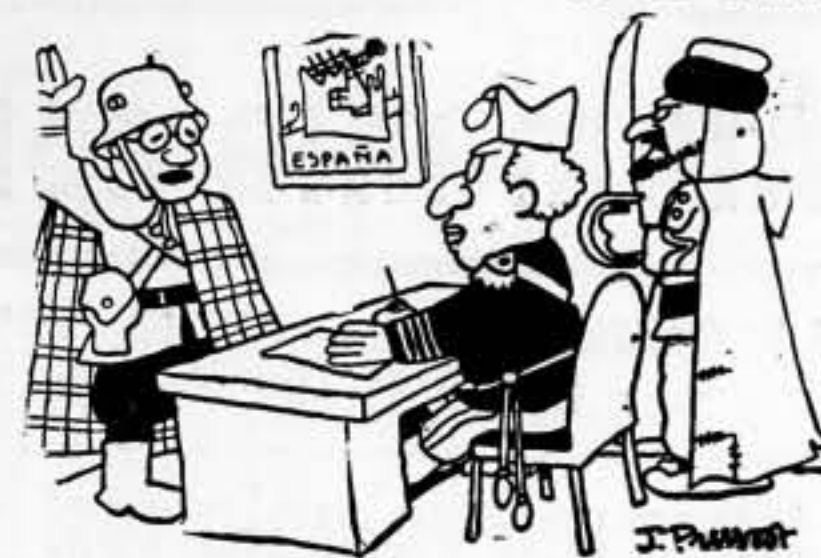
FRANCO. — ¿Y mi declaración sobre la integridad del territorio español? Está a consideración del gobernador italiano. (De "Vecond")