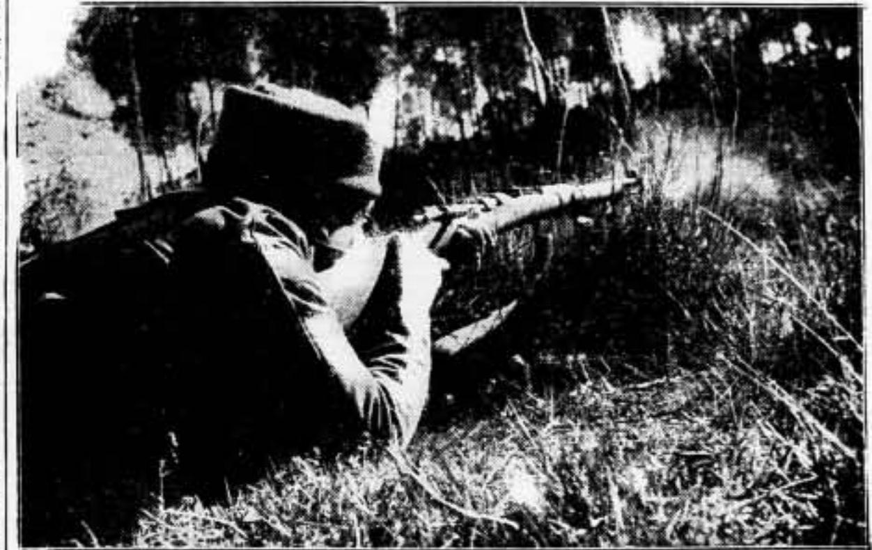
En esta imagen debemos tener puesta la imaginación todos los antifascistas de la retaguardia