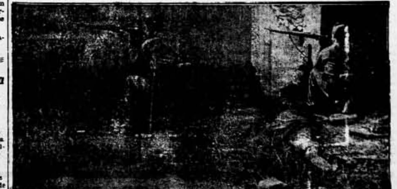
Las últimas casas del pueblo arrebataado, se defienden nuestros bravos camaradas, ojo avizor, a la mira del fusil; son ejemplos de los que la victoria conquista.

FACILITAR TRINCHERAS, ABRIGOS Y REDUCTOS A NUESTROS SOLDADOS. ES ELABORAR LA VICTORIA FINAL. PONER OBSTACULOS ANTE EL INVASOR, EQUIVALE A SU ANIQUILAMIENTO