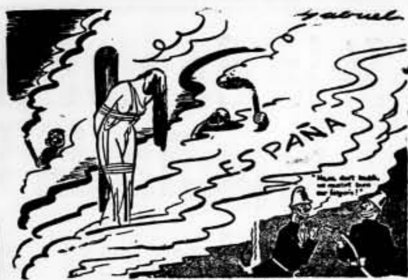
SEGURIDAD ANTE TODO ¡No, dejéis, no vayamos a quemarnos los dedos!

ORGANO DE LA CONFEDERACION REGIONAL DEL TRABAJO EN CATALUNA AIT ORGANIZADO POR LA CONFEDERACION REGIONAL DEL TRABAJO DE ESPAÑA Barcelona, sábado 2 de abril de 1938 Año VIII - Epoca IV - Número 1850