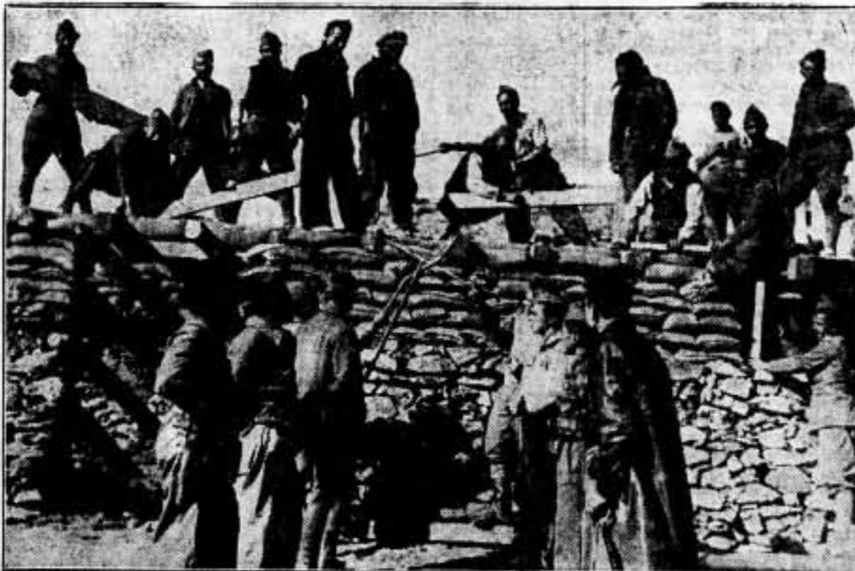
Ejemplo vivo: Estos soldados fortifican el frente para que el invasor no llegue a la retaguardia. El hombre de la retaguardia debe responder a ello construyendo el dique contra el que se estrellará totalmente el invasor.