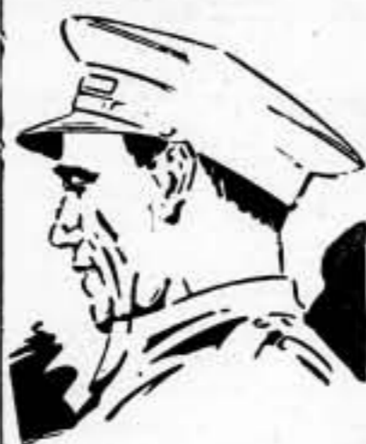
Este es Cipriano Mera, alma del ejército triunfador de Guadalajara, que ha reanudado su empuje vigoroso hacia delante. Este es nuestro Cipriano Mera, ejemplo de disciplina, que ha hecho del mando un magisterio. Continuator de la obra espiritual de Durruti y seguidor de la pragmática: "Renunciamos a todo, excepto a la victoria"

Ha continuado la victoriosa ofensiva leal en el frente de Guadalajara. Los ataques sobre Tamarite son contenidos por las fuerzas republicanas