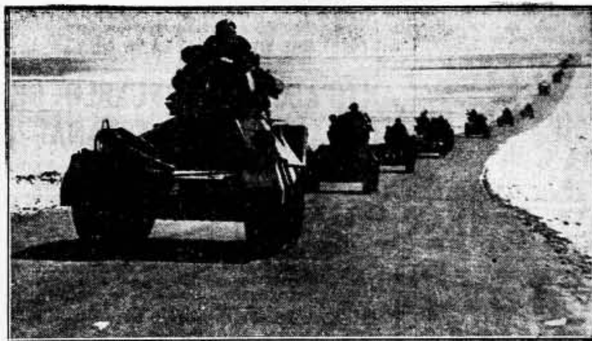
La brigada del Canal de Suez, está realizando maniobras en la región de Wadi Natrum. Los carros y los camiones del Ejército británico, sobre una carretera de basalto, construida en pleno desierto.