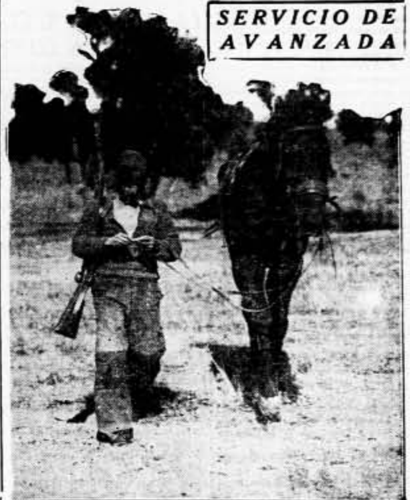
El centinela hace su pitillo, mientras vigila, pie a tierra para no ser visto, el movimiento del enemigo. Hay en la cara del compañero combatiente una sensación de pausa o descanso, seriedad de los momentos graves que a todos nos concierne.

Los agentes provocadores están en todas partes. Mucho cuidado, compañero