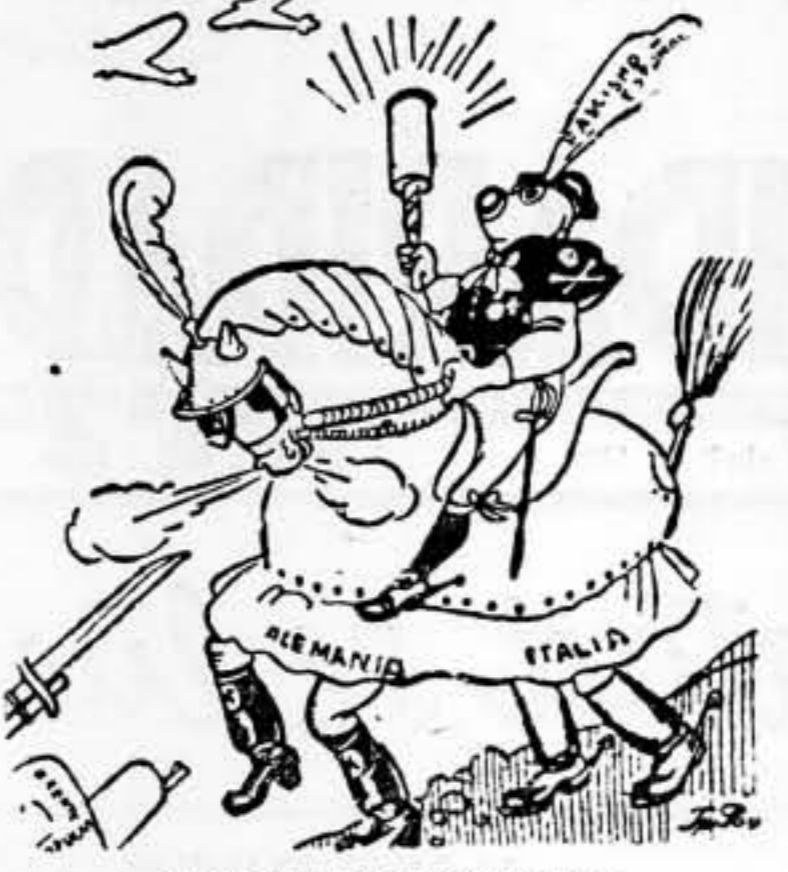
EL CABALLO DE TROYA ESPAOL (De «Krasna Zvezda»)