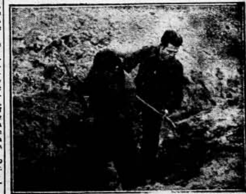
¡Fortificaciones! Estos compañeros realizan fortificaciones en el frente para contener al enemigo, que avanza hacia la retaguardia. La obtención de ésta es, cuando menos, imitarlos

En Extremadura se combale en el interior de Carrascalejo un bimotor a ciso derribado