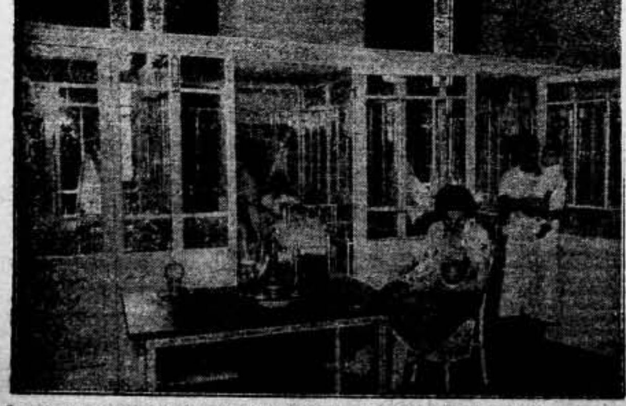
En mujer es un soporte de la guerra en la retaguardia. La guardería infantil a el dispensario, son un elemento de lucha decisiva, defendidos por el hombre. La mujer, oficio de médico al oficio de madre

S ORGAN Barce El AL TIE El p ma MINI DEFEN EJE ESTE Ebro, s Segre Pallares nuestras camente Escarpe una peq pero qu por el f turas p pueblo. En el que cub habido terés. Más a mell, r han tom el nemi continua de conte tracione la carre San Ma En el na, las f contra brijo, lo La Gra 1.215, p final de Los r fuerte llera so ciones i metro 1 de Cas tratador cia Mas de hau rechaza seles al EJE TREM blo de C a medio en nue cieron