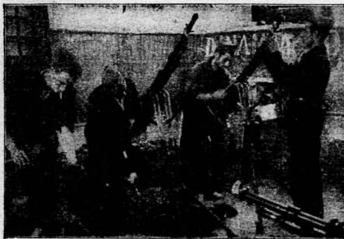
La limpieza de la ametralladora antiáerea, defensa singular de los pueblos atacados por la aviación del enemigo. En estos días de ofensiva enemiga por los pueblos de Lérida, la ametralladora antiáerea es la única arma eficaz