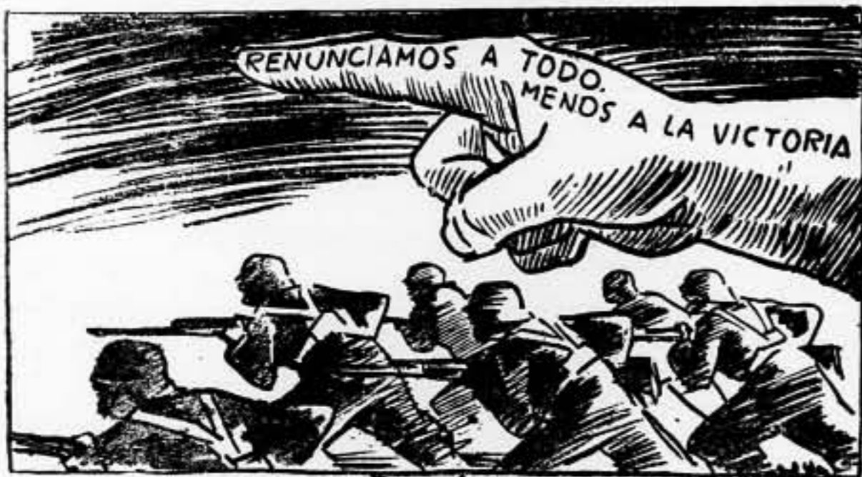
DURRUTI SEÑALÓ EL CAMINO

Todos nuestros frentes responden con moral admirable