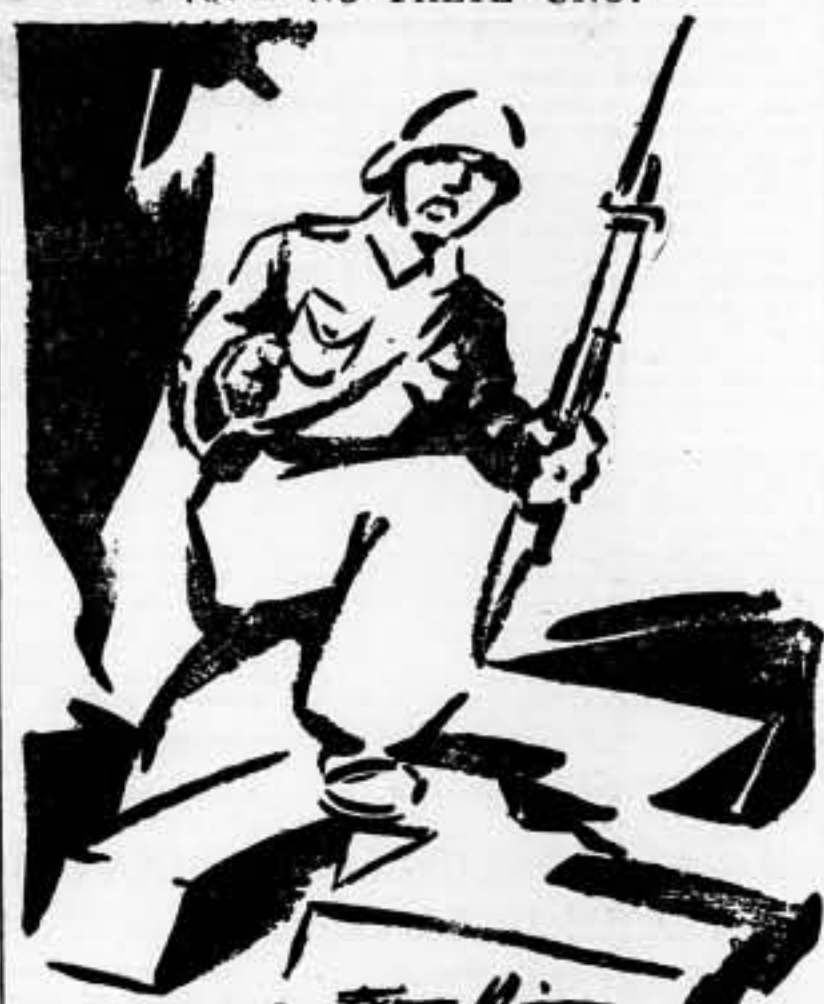
Tú, yo y todos defenderemos España