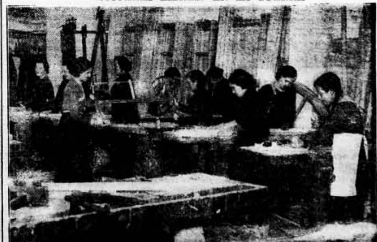
Así aquí cómo substituyen las mujeres antifascistas a los hombres que marchan al frente movilizadas para la defensa de España contra los invasores

Este número ha sido visado por la previa censura