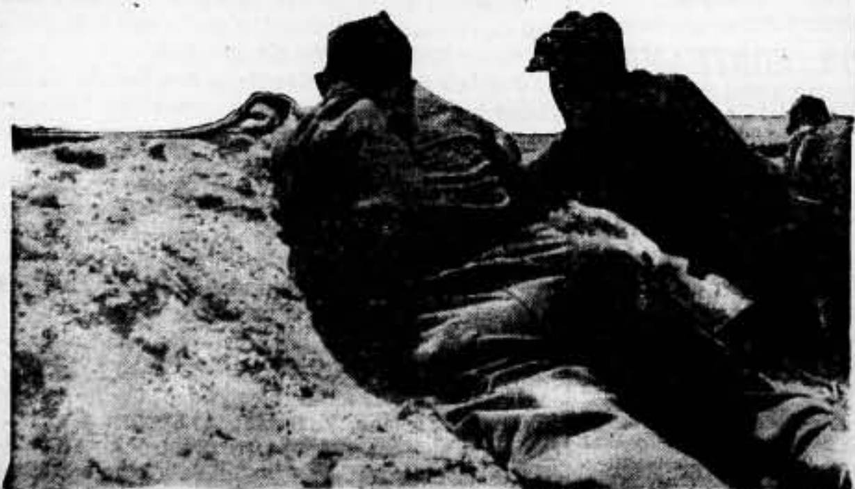
Pagados al sueldo, inmóviles, firmes, esperan nuestros soldados el ataque enemigo. La consigna es "resistir y resistir". ¡Y ellos lo cumplen con el mayor fervor

La comprobación de la ilegalidad de la gestión del Gobierno Schuschnigg implicará, entre otras varias medidas, la anulación de la retrocesión de los bienes de la familia Habsburgo. — Faber.