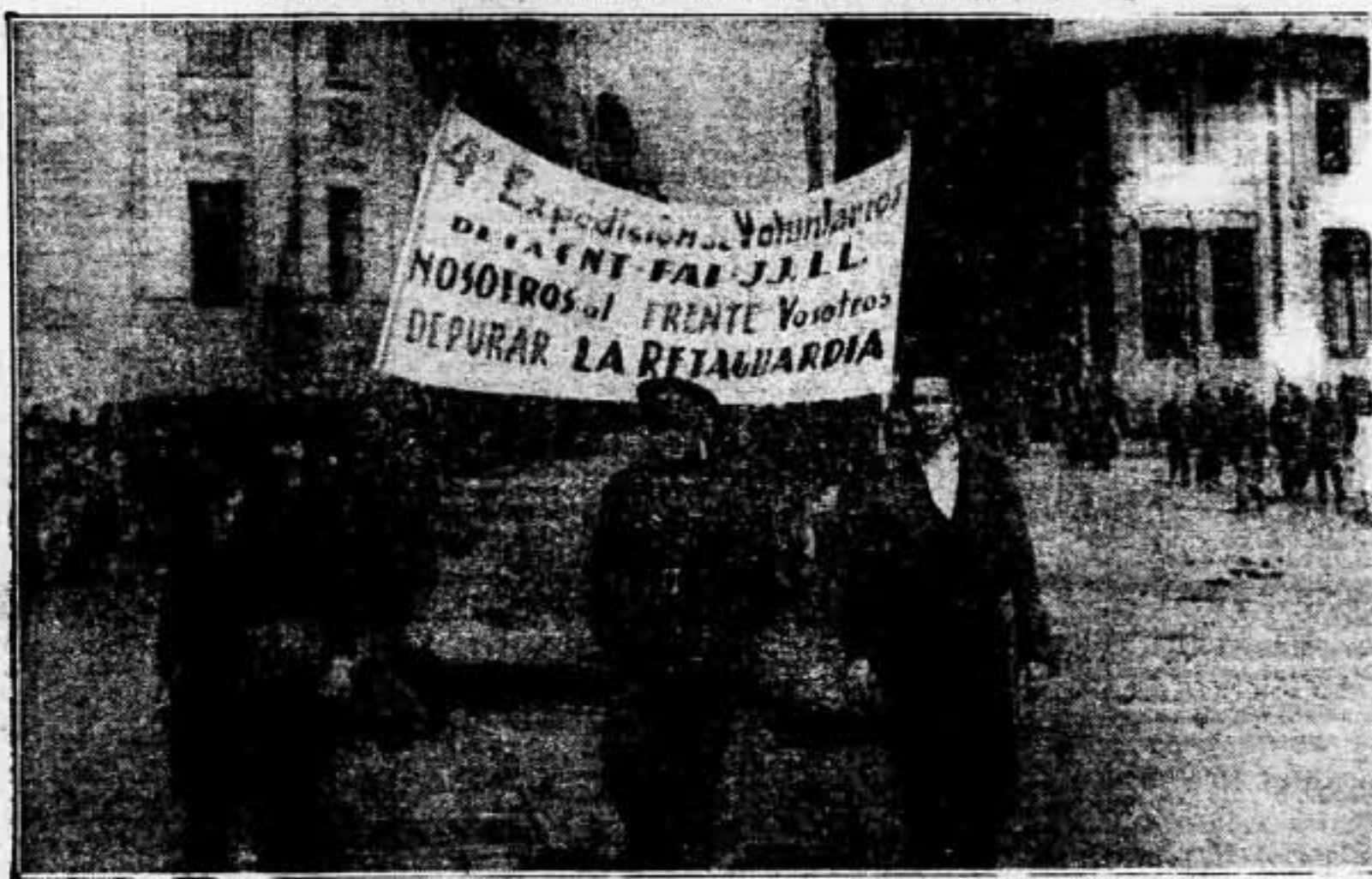
Con la máxima rapidez y energía, con intenso fervor, el movimiento libertario de Cataluña, como el de toda la España leal, ha respondido y está respondiendo a los llamamientos de movilización del voluntariado.