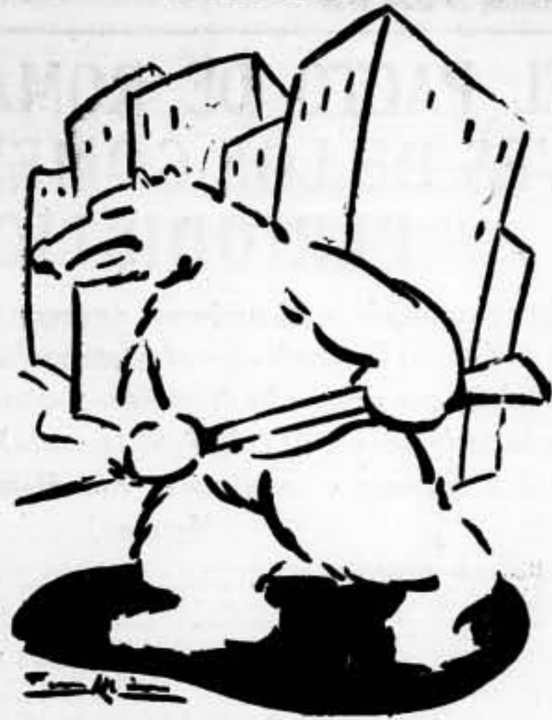
Madrid está dispuesto a todo. ¡Fíjmonos en Madrid!