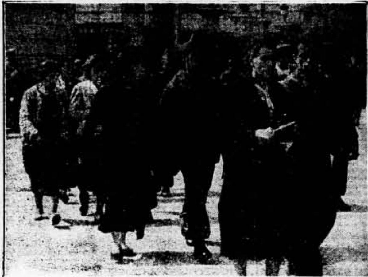
Con sus esposas, con sus madres, marchan los jóvenes libertarios a la estación, a buscar el tren que les ha de conducir al frente de combate. En sus rostros resplandece la decisión de un voluntariado auténtico. No es esta estampa una escena de dolor, sino de esperanza y seguridad. Se advierte en esas mujeres que acompañan a los bravos jóvenes libertarios, la encarnación del espíritu señero del 19 de Julio.