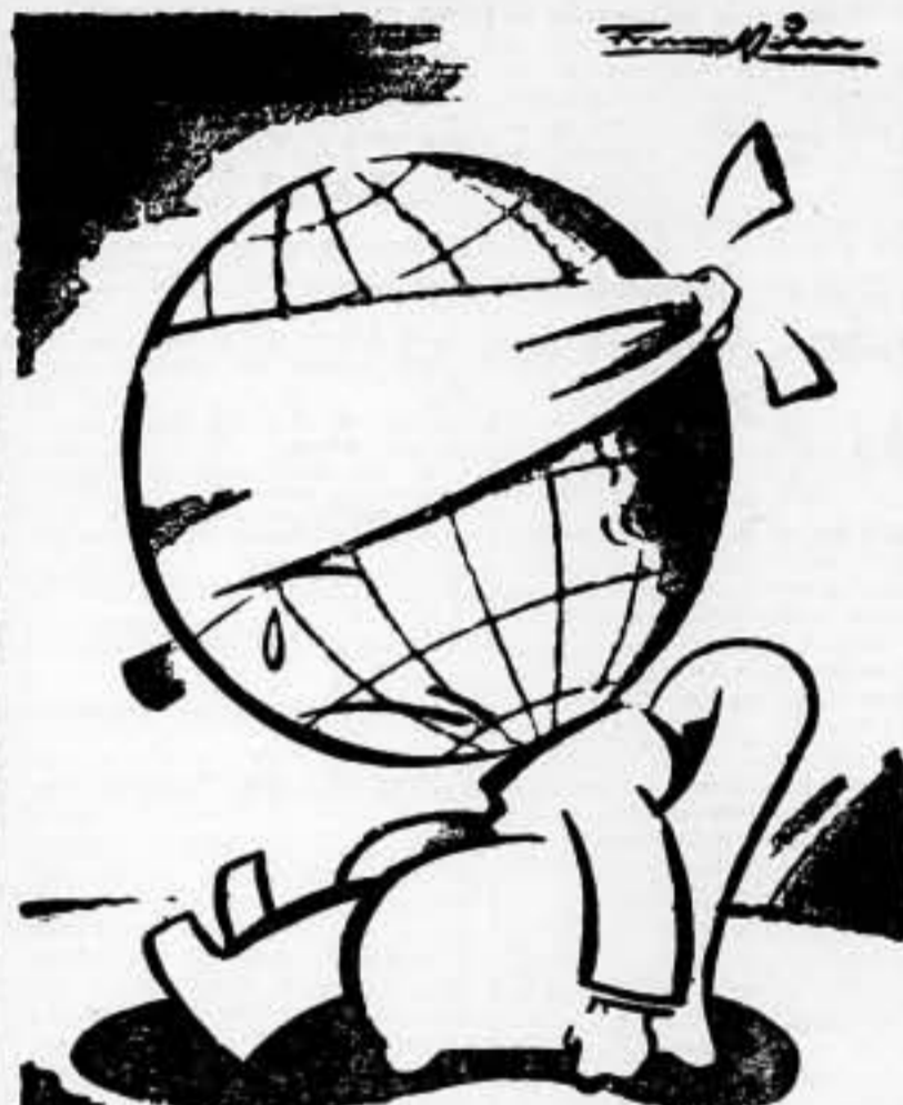
Pero bueno; ¡es que no va a haber nadie que me dé una aspirina!