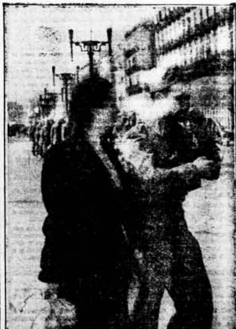
Esta sencilla instantánea demuestra el carácter de nuestra lucha. Es un compañero de la 5.ª expedición libertaria; marcha al frente acompañado de su mujer, y en los dos se advierte una serenidad absoluta, extraña del deber. Nuestros jóvenes libertarios van al frente por propia voluntad de ellos y de sus familiares. Van solos, sin conexiones de ningún género, porque les llama a la lucha el imperativo de raza, y la tradición de un ideal concreto. Fotografías como ésta no se pueden publicar en el «otro lado».