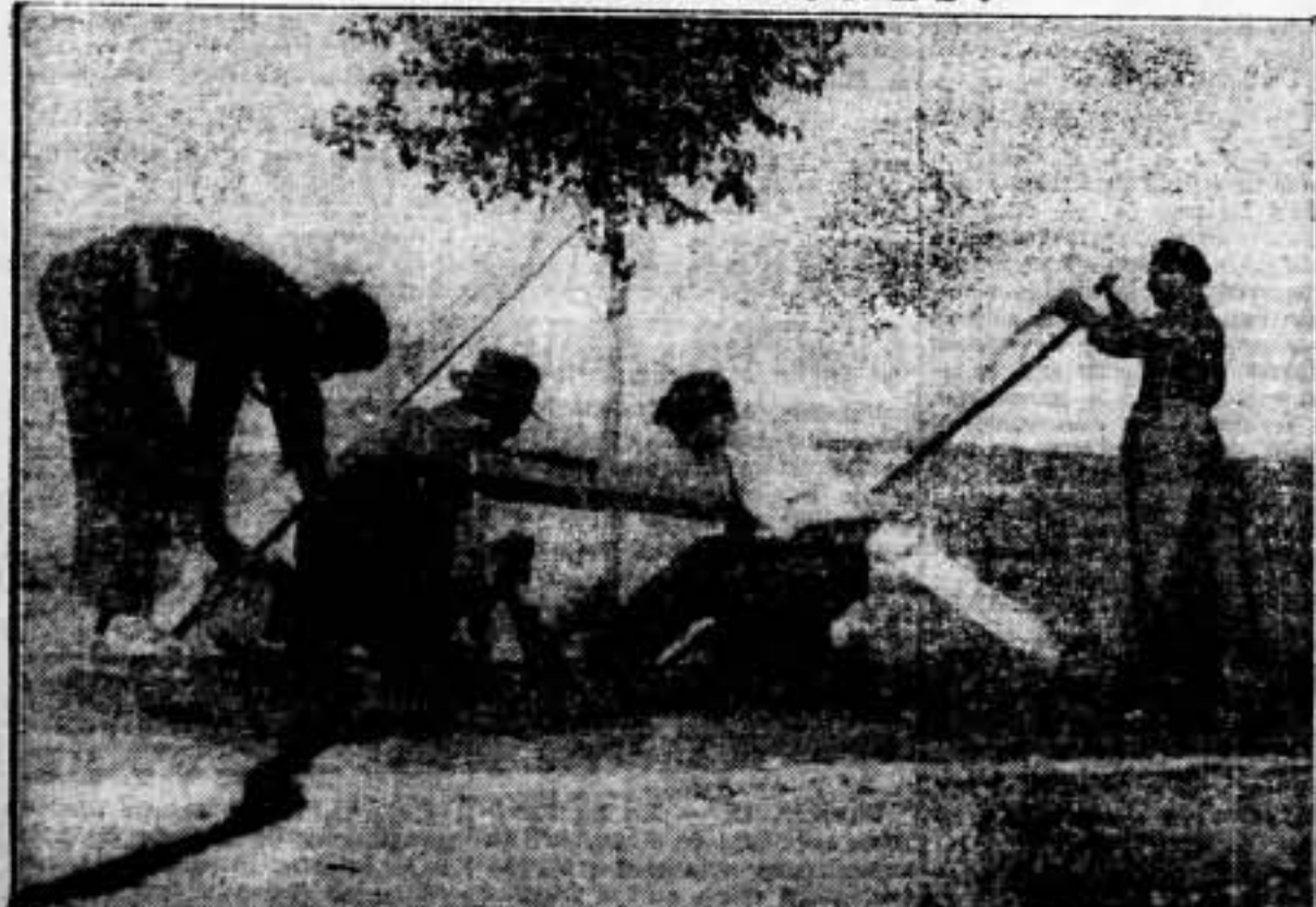
No nos olvidemos de fortificar. Sirvan nuestras llamadas de recuerdo, como esta «foto» debe servir de ejemplo para los que, debiendo emplearse en esta necesidad perentoria, se encuentran aún ociosos.