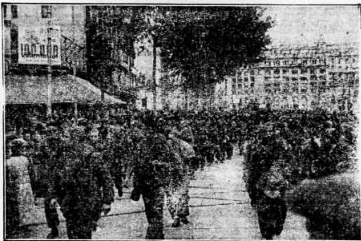
Los jóvenes libertarios abandonan la ciudad —descanso de ansias guerreras— sin ningún temor. Van a triunfar en una lucha en nombre de la sensibilidad universal