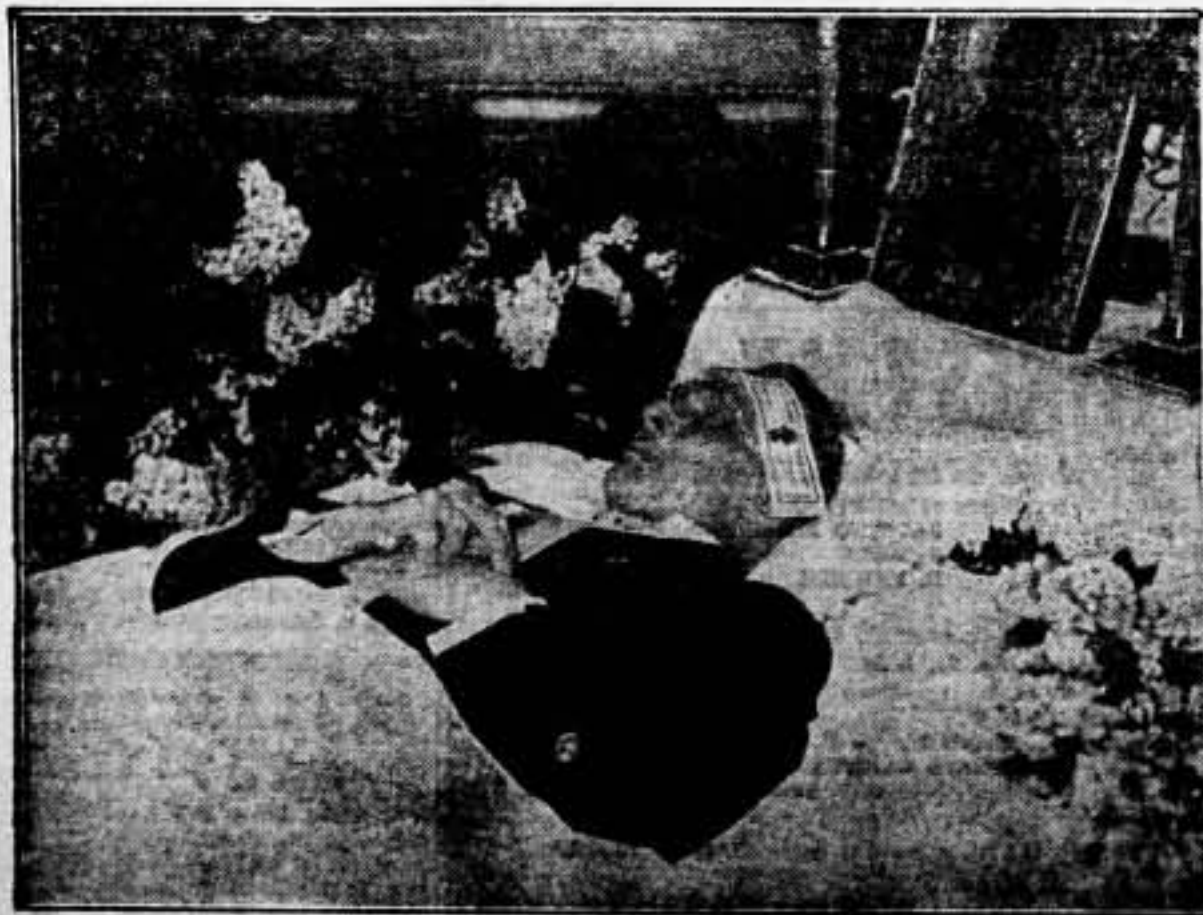
Veí aquí al cantante Chaliapine —uno de los mejores bajos del mundo— en su lecho de muerte. Chaliapine era un "ruso blanco", pero era un buen cantante. Recuerdo, como si fuera la fotografía cuando estaba vivo. Por eso le dedico hoy, realizando un tributo al arte