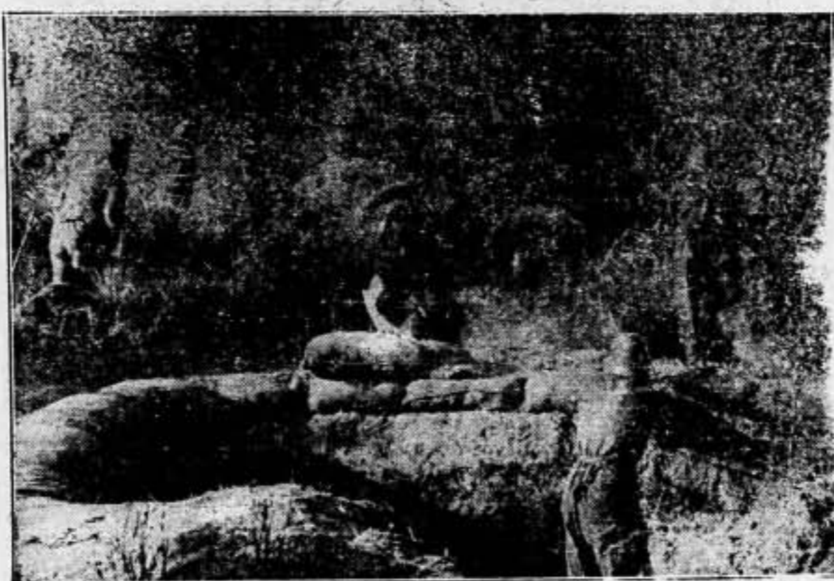
Tras la resistencia en el parapeto, el asalto a la bayoneta sobre las posiciones enemigas

— La hora es de acción energética y concordante, sin reservas ni titubeos de ninguna especie. Para ello es indispensable que TODOS se ajusten al ritmo y a la responsabilidad de la lucha actual. Que nadie olvide sus ritmos y sus responsabilidades, y podremos dedicarnos todos, exclusivamente, a las tareas de la lucha y del trabajo. Es lo menos que ahora puede pedirse.