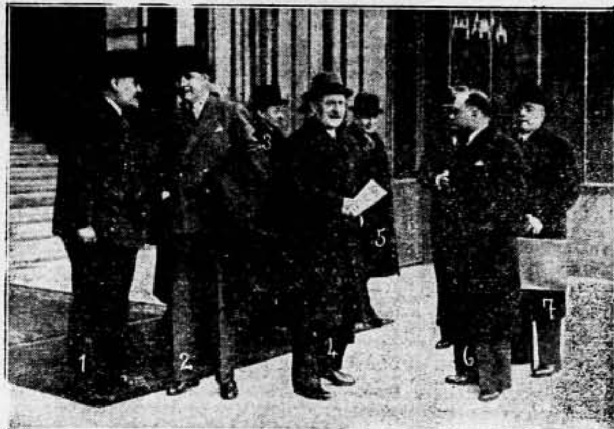
Algunos miembros del Gobierno francés al salir del Consejo de ministros: 1, Ramadier, ministro de Trabajo; 2, Patenotre, ministro de Economía; 3, Reynaud, de Justicia; 4, Chautemps, vicepresidente; 5, Mandel, de Colonias; 6, Zay, de Instrucción Pública; 7, Serrault, del Interior.