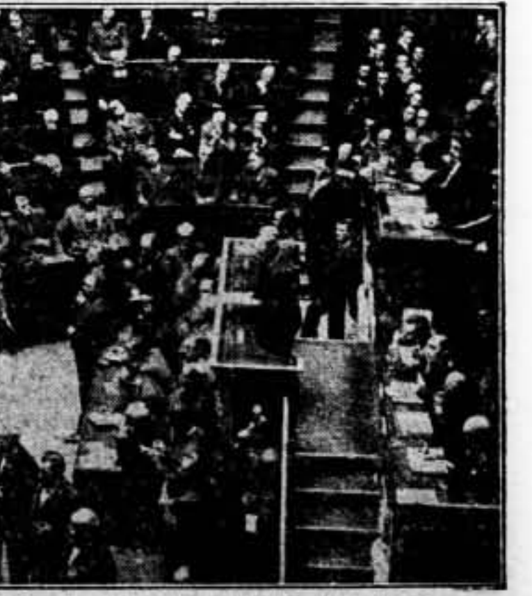
El presidente del Gobierno francés, leyendo su declaración ministerial ante la Cámara