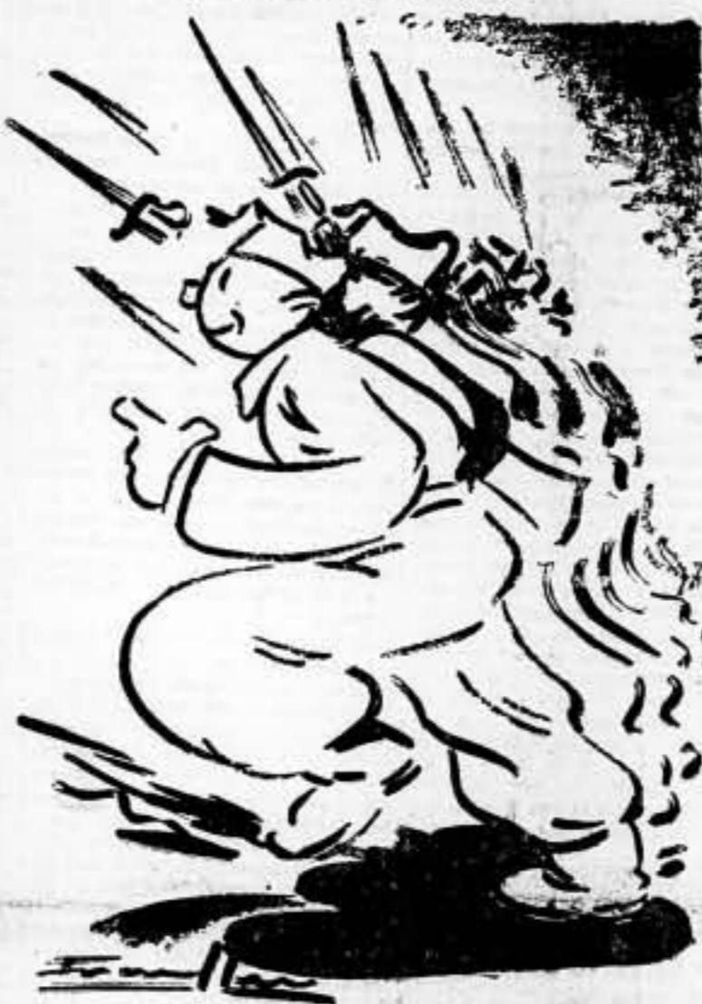
Con la sonrisa en los labios. Lo que no puede hacer Franco.