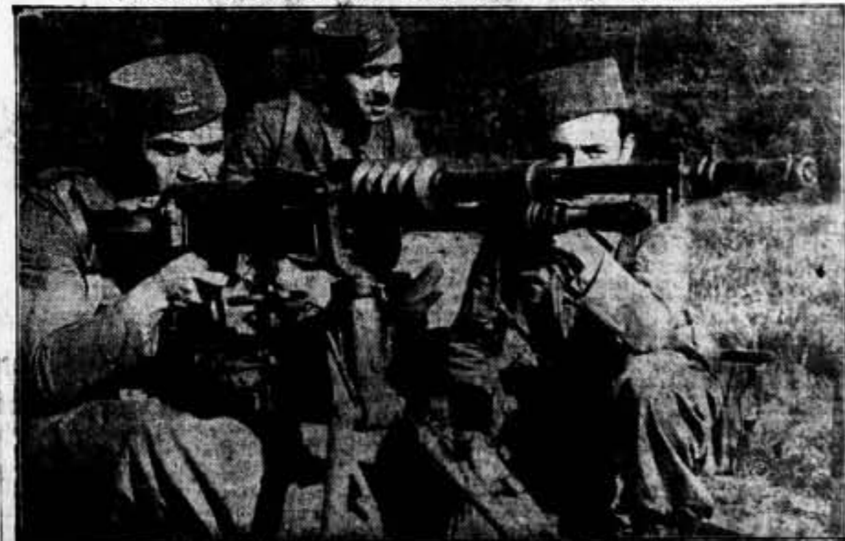
Prácticas de ametralladora, por los alumnos de la Escuela de Guerra del Ejército Popular, vivieron de una auténtica lección militar al servicio de la verdadera España.