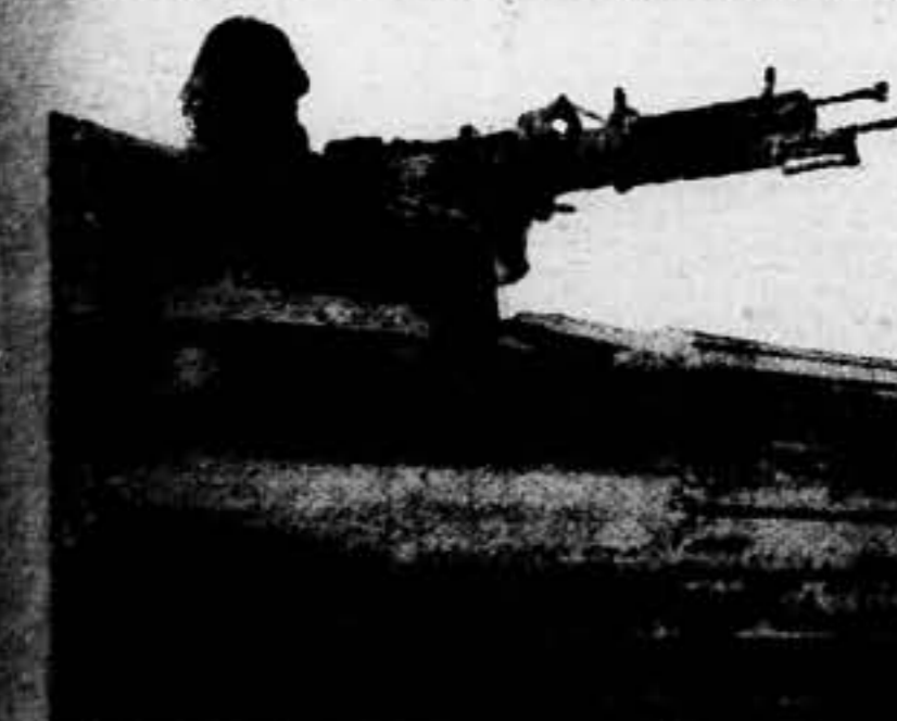
En el momento del "ceceo" leal es, junto a la torre de su ametralladora, la sensación de seguridad de una guardia trabajadora.

La España antifascista no será sacrificada.