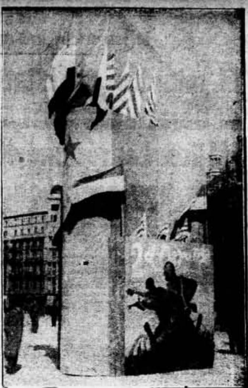
Banderas colocadas por el Frente Popular, en la Plaza de Cataluña, con motivo del Primero de Mayo.

Las conversaciones franco-británicas permitieron encontrar una fórmula de solución a la espinosa cuestión del control terrestre, forma para la cual se cree necesaria la conformidad de las delegaciones italiana y alemana. En estas condiciones la discusión del proyecto de retirada de los combatientes extranjeros y el envío de comisiones internacionales a España progresará considerablemente. —Fabra.