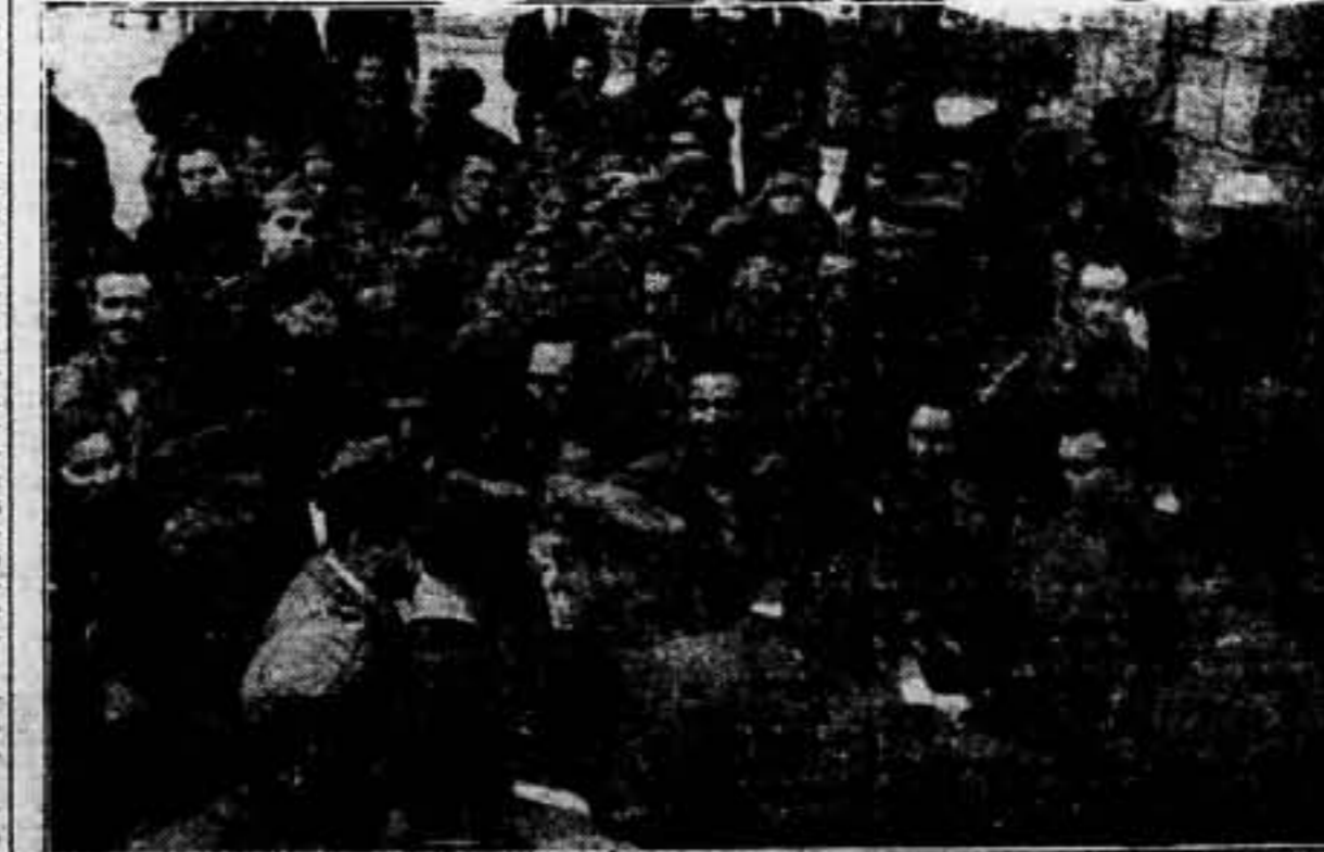
Grupo de soldados venidos del frente, para conmemorar la fecha del Primero de Mayo, con un saludo a las trincheras