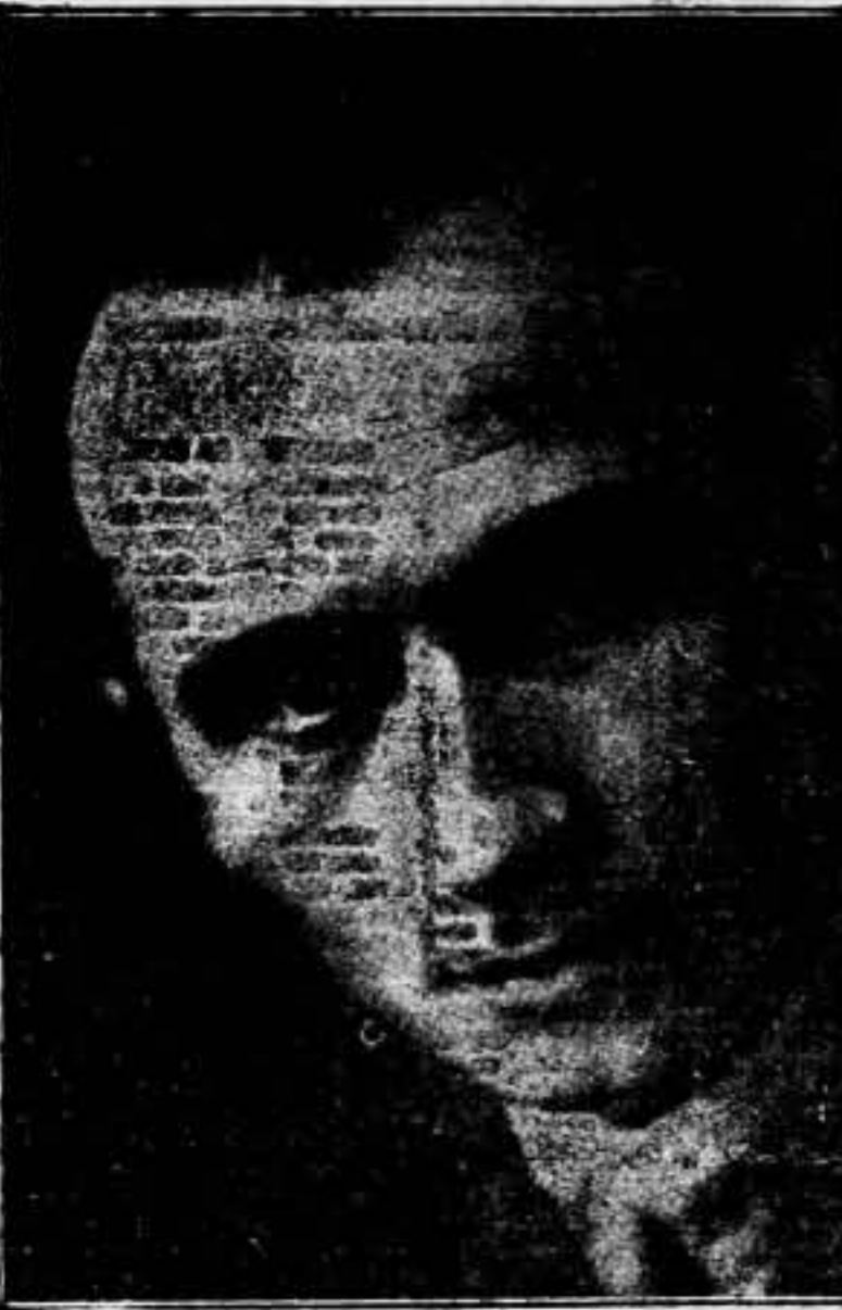
Profesor CAMILO BERNERI

Militante anarquista de renombre internacional. Vino a España a colaborar con nosotros en la lucha antifascista, y aquí quedó. Su nombre, su prestigio, su libertad, su vida, todo lo sacrificó en honor de la causa española. Pereció, hace un año, pero su recuerdo no se extinguirá jamás