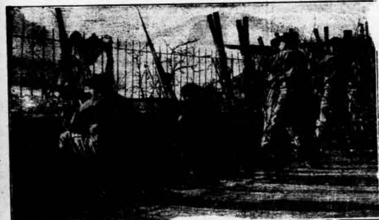
Nuestros bravos combatientes se hacen fuertes en un reducto que ha de servir para impulsar más tarde un avance sólido. Estos bravos soldados están escribiendo una gesta importantísima contra el fascismo