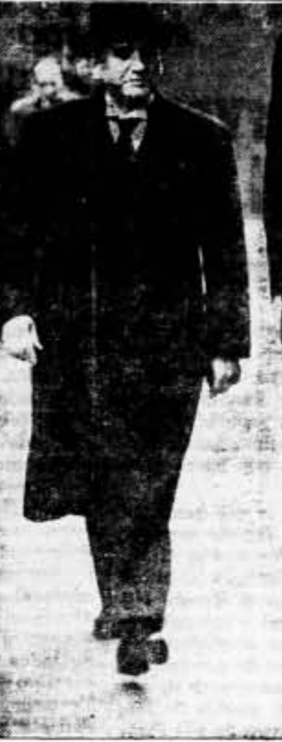
Las conversaciones anglofrancesas continuaron en "Downing Street" y después almuerzo Daladier, primer ministro francés, y Bonnet, ministro de Negocios Extranjeros, con lord Halifax, ministro de Estado de Inglaterra, en el "Foreign Office". Lord Halifax y Daladier, dirigiéndose de "Downing Street" al "Foreign Office" para el Agape.

El primer ministro francés almuerza con Lord Halifax