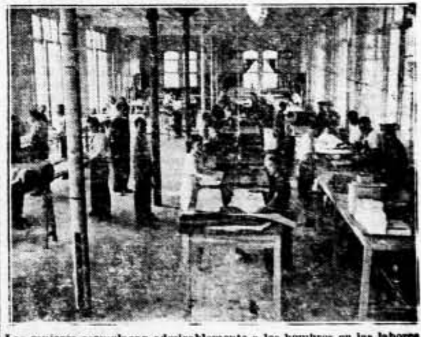
Las mujeres reemplazan admirablemente a los hombres en las labores de retaguardia. Un Pueblo que lucha y trabaja así, con la sonrisa en los labios, a pesar de todas las adversidades, tiene, forzosamente, que alcanzar el triunfo. Y este Pueblo es España, la España republicana, que en su lucha contra el fascismo internacional es la admiración del Mundo, incluso de aquellos que nos atacan.

Además, y principalmente: aquella es la aspiración primera de quienes, por todos los medios y en todos los planos, se opusieron al movimiento subversivo de la sublevación fascista.