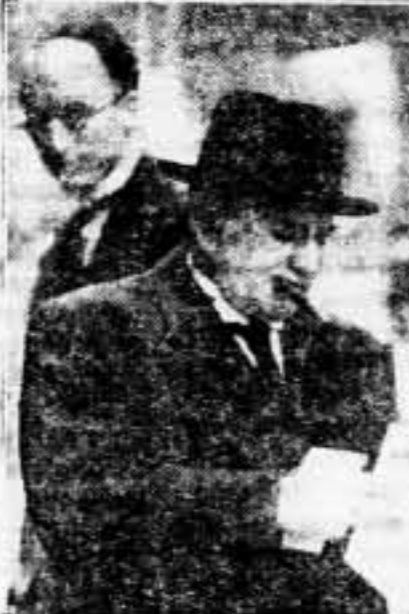
Daladier y Bonnet, sorprendidos por la cámara en "Downing Street", después del almuerzo con que les obsequió lord Halifax.

LAS TROPAS «NACIONALISTAS» LEEN EL «POPOLO D'ITALIA»