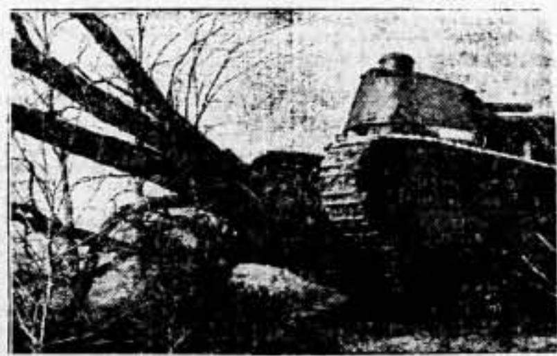
Las secciones motorizadas y las unidades de tanques del Ejército español, acaban de efectuar importantes maniobras. Véase aquí cómo un tanque de 70 toneladas avanza sobre un árbol.

Terminar cuanto antes los emboscados, dondequiera que se encuentren, y enfrentarse decididamente con el problema del abastecimiento. No basta poner tasa a los precios, hay que evitar, además, que estos se oculten a la venta pública, para venderlos clandestinamente a precios fabulosos. Es más que nunca, época de muerte al ladrón, y en este caso el peor ladrón es el que aprovecha la tragedia del Pueblo en lucha por la libertad, para enriquecerse.