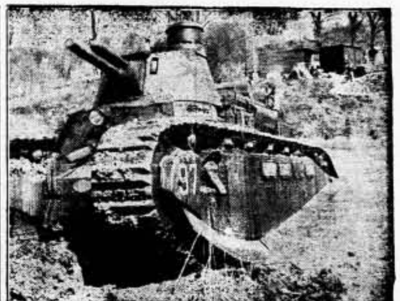
Fotografía tomada durante las maniobras que han tenido lugar recientemente en la región de Verdún, donde los tanques de 70 toneladas se ejercitaron cruzando ríos y salvando toda clase de obstáculos.

Washington, 12.—El secretario de Estado, Sr. Cordell Hull, ha declarado oficialmente una información que publica el «Baltimore Evening Sun», según la cual tenía a intención de dimitir. El Sr. Hull declara que se asocia a la declaración pronunciada a fines de abril último por Sumner Welles, subsecretario de Estado, según la cual Hull había aprobado el comentario de Roosevelt, relativo al acuerdo angloitaliano. — Fabra.