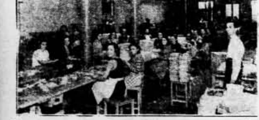
Es aquí nuestra retaguardia. Las industrias en plena actividad, y en ellas, nuestras mujeres, trabajando sonrientes, con la sonrisa de quienes tienen el pleno convencimiento de la victoria.

Todo ello va avalado con fotografías de documentos de gran interés y con relatos autorizados que ponen de relieve la actuación de los secuaces de Hitler en España: «El nazismo al desnudo» constituye por ello un libro imprescindible para todo buen antifascista.