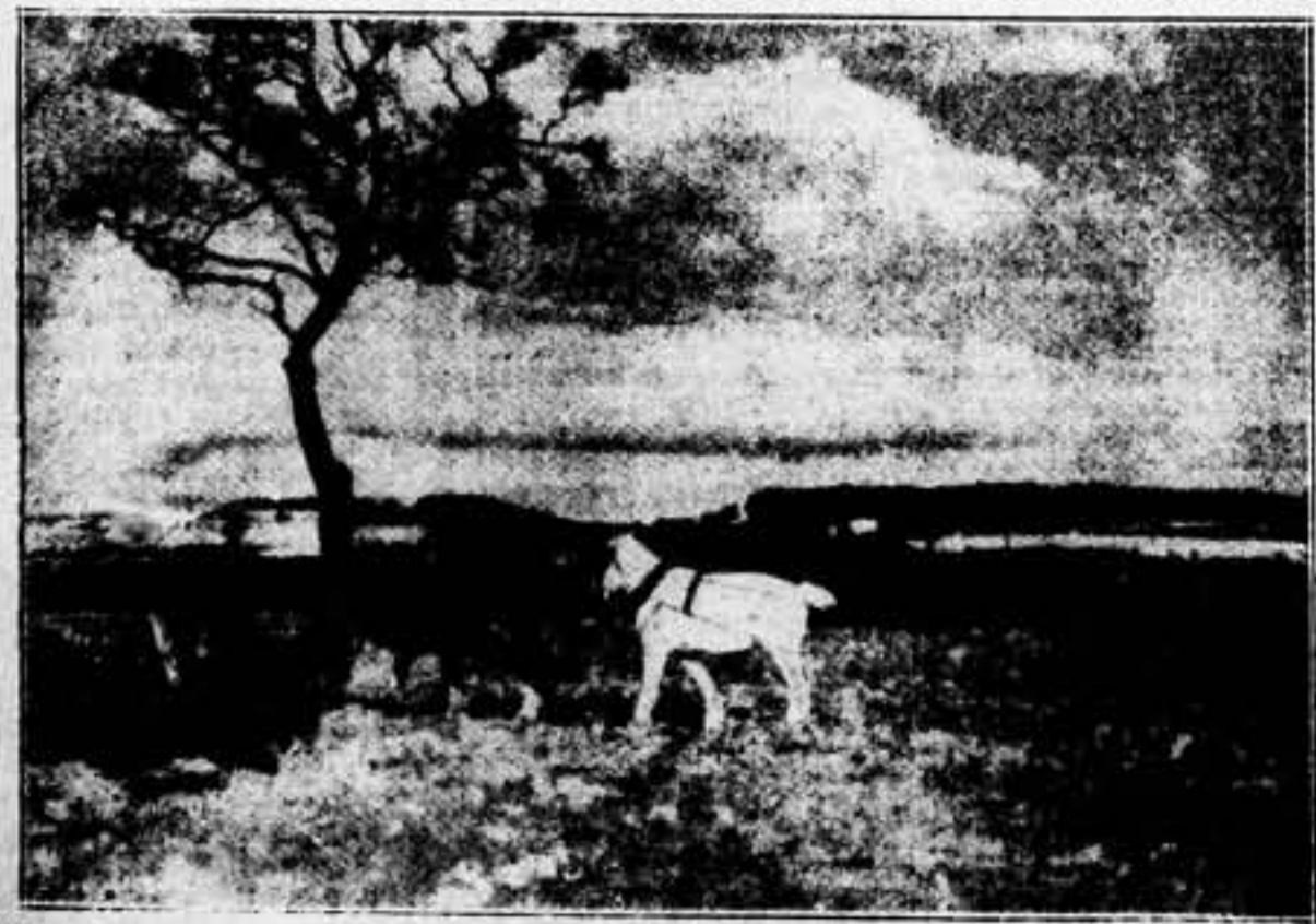
Sobre la tierra de nuestra zona, el campesino cuenta con preciosos auxiliares en las bestias de labor. Preciso es que éstas se agrupen —mediante el trabajo en Colectividad— para sacar de ellas el rendimiento debido...

CAMPESINO: Trabajar en el campo, empuñar un fusil, secundar los acuerdos del Frente Popular, es propiciar tu redención