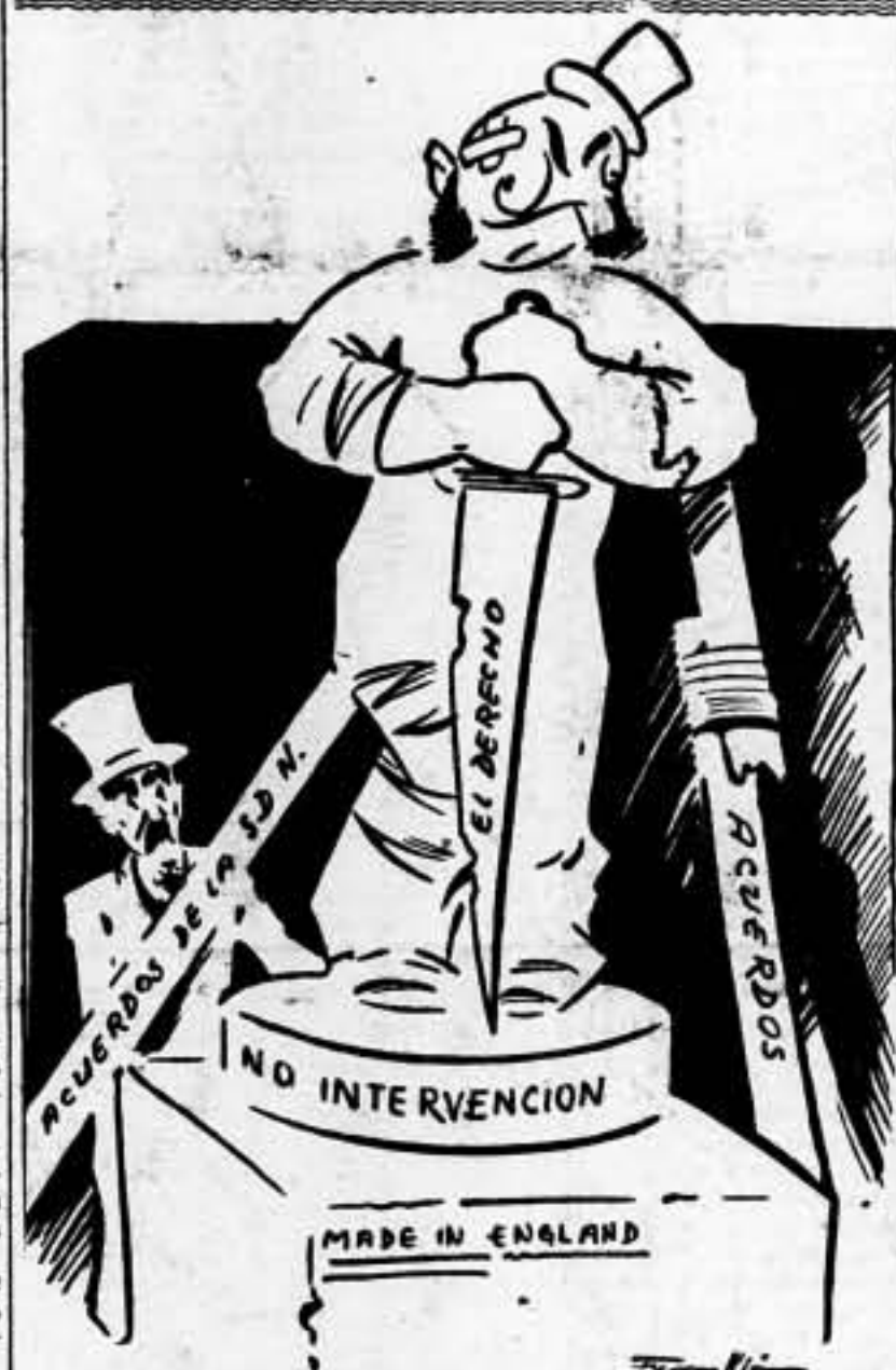
Chamberlain: ¡Luego dirán que no soy el mejor escultor!

El Gobierno británico se reserva el derecho de reclamar compensaciones al final de las hostilidades; pero, ¿será esto, entre tanto, un consuelo para las tripulaciones bombardeadas? — Ag. España.