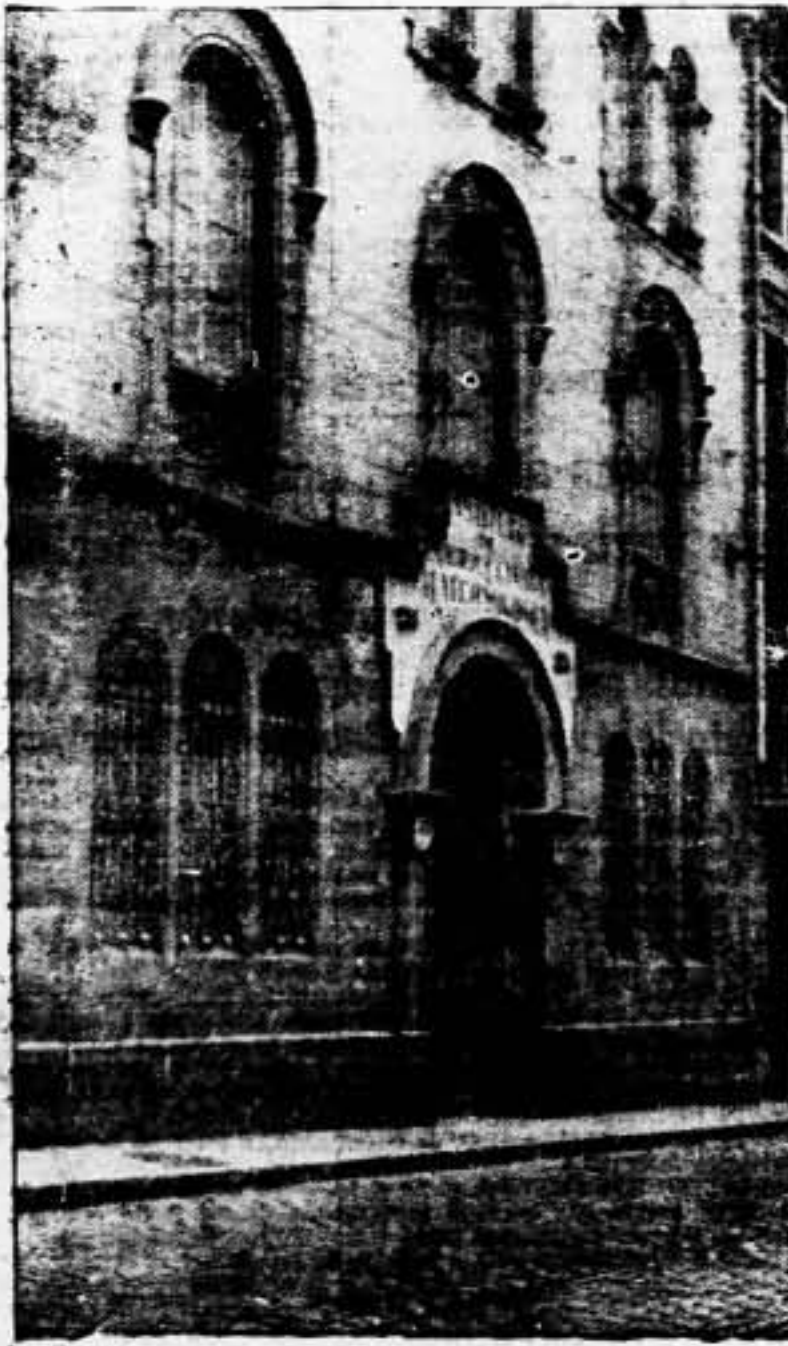
Fachada principal del Instituto de Puericultura y Ginecología, de la C. N. T.

Una prueba fehaciente de que no reza con nosotros la máxima gor-