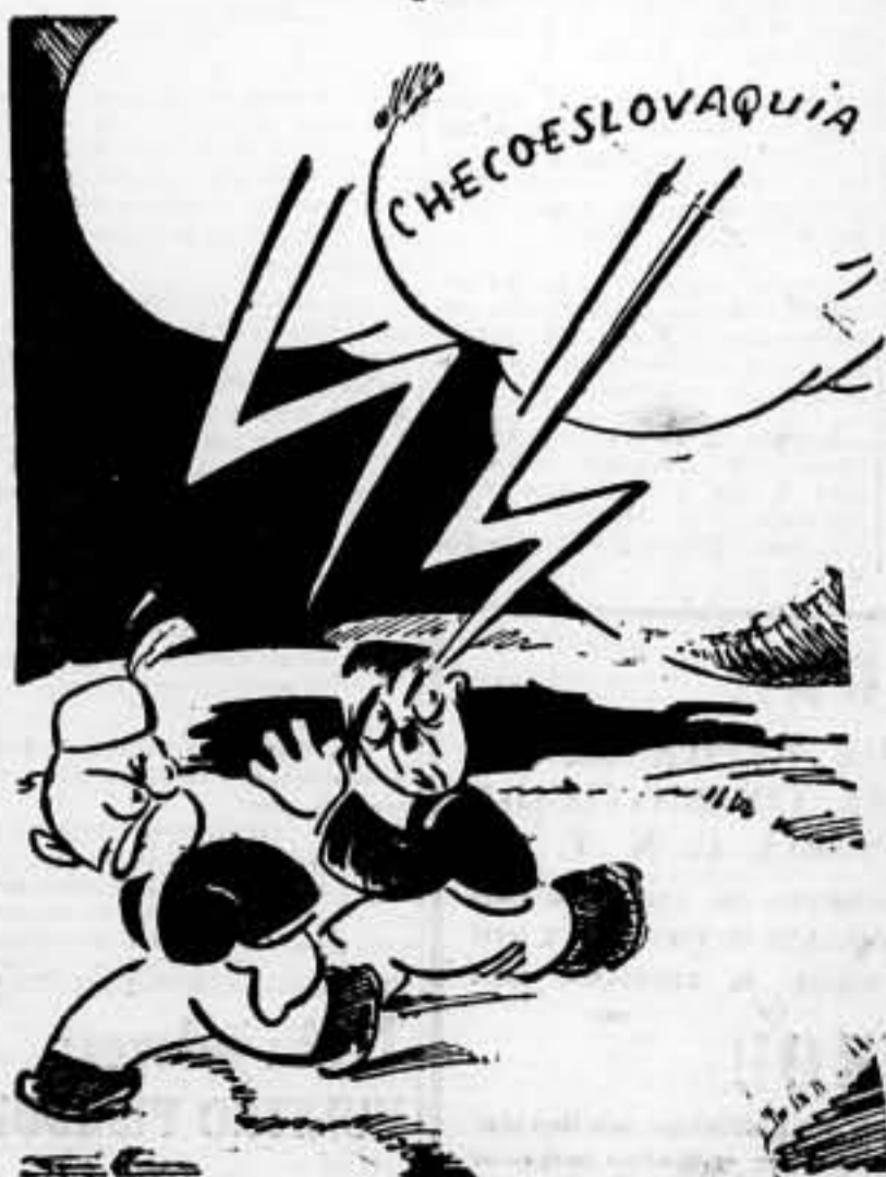
Hitler. — ¡Y yo que creía que esos rubos eran algodón en rama!