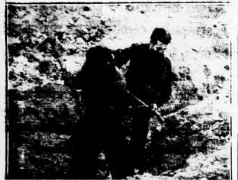
Compañeros del Ramo de Construcción, en trabajos de fortificaciónes de Barcelona. Su trabajo es la guerra lo mejor de sus hombres y la mayor cantidad de sus medios.

Removidos los delegados de obras, con las representaciones sindicales de la U. G. T. y de la C. N. T. y del Comisariado General de Guerra, se ha tomado el acuerdo de ir