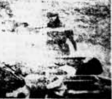
Tanques checos "camuflados" para desorientar a la aviación enemiga.