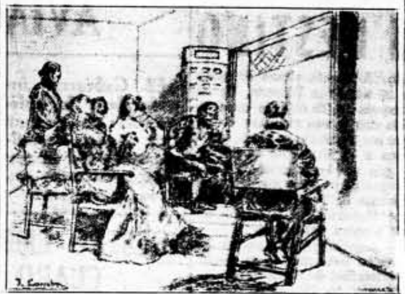
Interior de un aposento en el Teatro del Principe, cuando estrenaba Lope de Vega

Para el desconocimiento del Monarca de la Naturaleza, fuera de España hay también otra razón que apunta sagazmente don Juan Valera, en el prólogo a la traducción de Shakespeare. Expone que en nuestro teatro no hay personajes—fuera del don Juan—con tanto aliento de vida, con tanta predilección para la inmortalidad como los héroes shakespearianos.