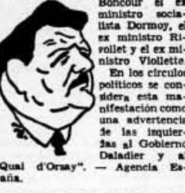
"Qual d'Orsay".

Añade el periódico que el restablecimiento del control en la frontera de los Pirineos no representa la prohibición de entrar víveres a la España republicana. Se proba-