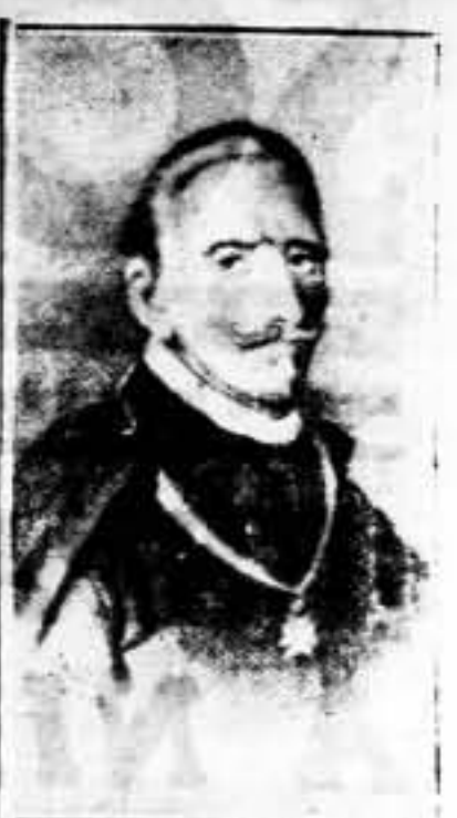
Lope de Vega, el Félix de los Ingenios, autor de "La esclava de su galán, que se representa en el Barcelona

Muchos creen que este desprecio era sincero por un arte que creía inferior, y que el cultivaba para vivir, hasta que a los cincuenta años se hizo cura. Porque la protección de los nobles a quienes Lope sabía