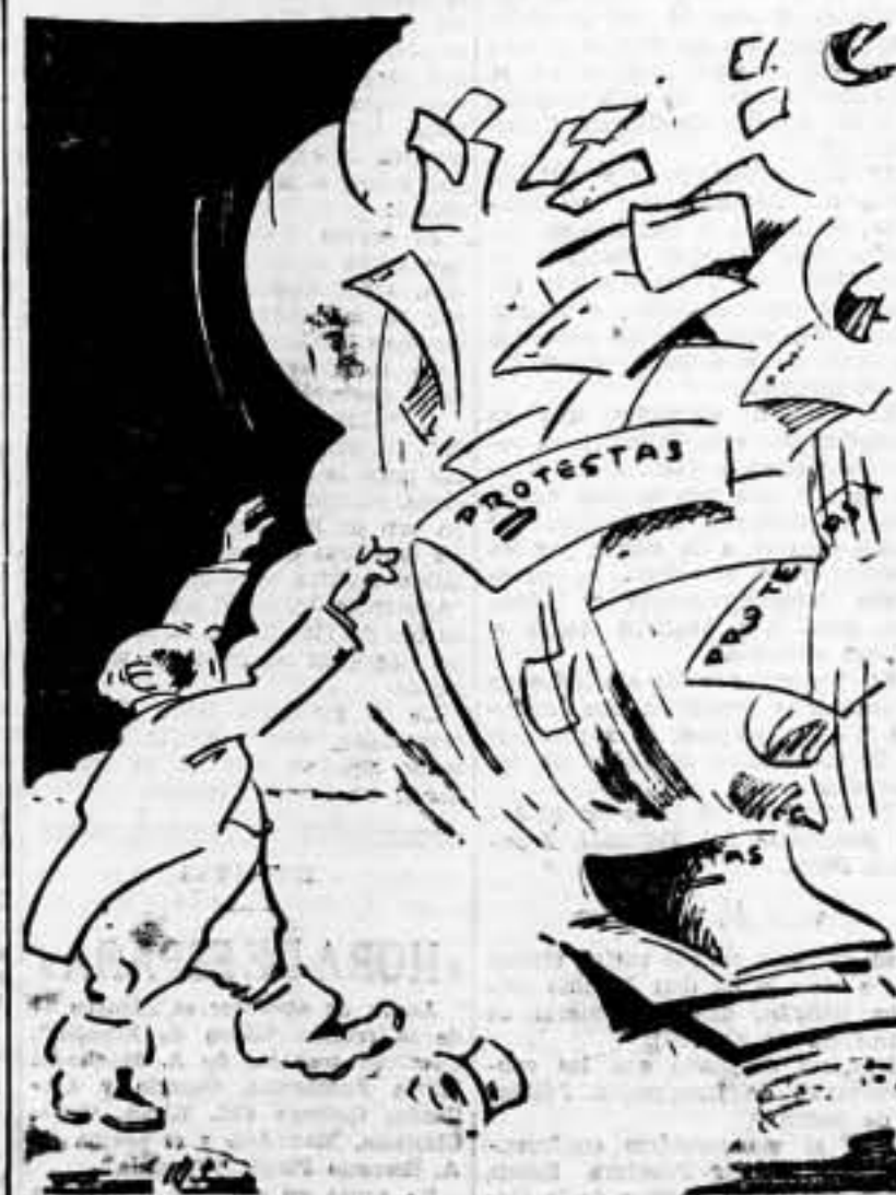
Las palabras se las lleva el viento