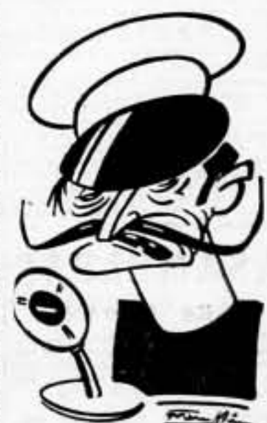
Las palabras se las lleva el viento

Leed los partes de guerra de ayer y del domingo en la página segunda