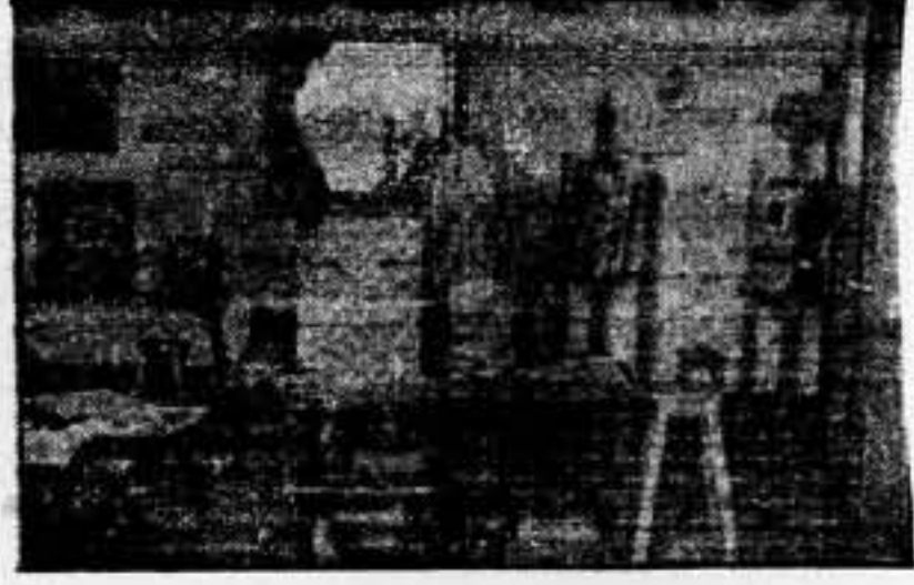
Esta es una de las aulas de la «Escuela del Treball i de l'Art», en la cual se ordenan e instalan las obras concluidas por los alumnos de las clases de Pintura y Modelado

pueblo de Blanes, en donde, aparte de otras cosas interesantísimas que ocuparán nuestra atención en otro momento, existe una Escuela de Trabajo y de Arte, creada en los albores revolucionarios de 1936, cuando la C. N. T. dirigía, casi exclusivamente el control de las actividades regionales.