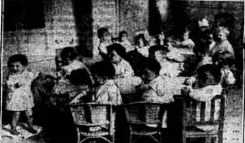
Demonstración de cómo son atendidos los hijos de los combatientes y refugiados.