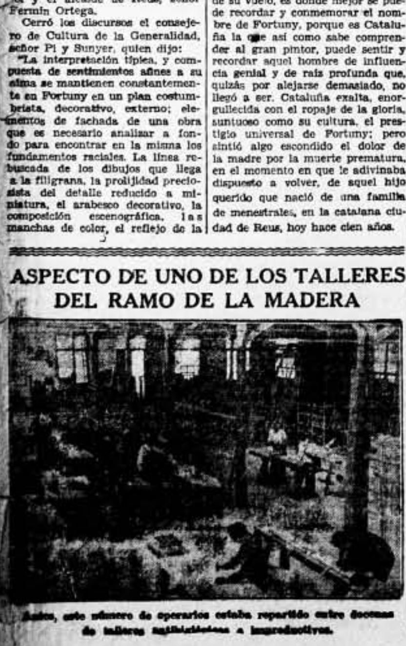
Este, este número de operarios estaba repartido entre docenas de talleres artesanales e industriales.