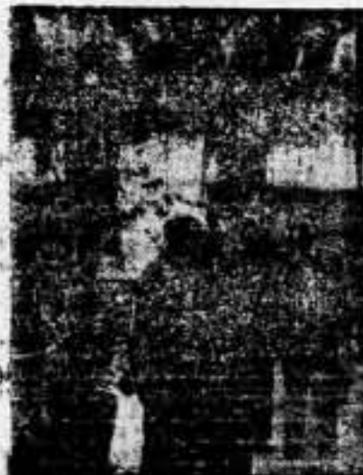
Puig Elías, el gran luchador intelectual, conversa en los jardines de la «Escuela del Treball i de l'Art» con los profesores de la misma, y éstos exponen al subsecretario de Instrucción Pública la necesidad de que el Estado ayude al sostenimiento de tan admirable centro de enseñanza, que hoy vive gracias al sacrificio de sus fundadores y sin apoyo económico de ningún organismo oficial

Un Ayuntamiento censista y un alcalde censista también, el compañero Enrique Coruella, dotaron a Blanes de este importante centro de cultura, sostenido desde entonces por el Municipio y por nuestro Sindicato, sin que ni el Estado ni la Generalidad de Cataluña se hayan interesado poco ni mucho por su desarrollo y prosperidad.