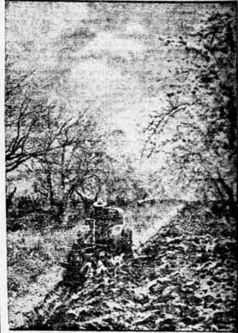
El moderno tractor traza el amplio surco bajo la fragante nevada de los árboles frutales en flor. Sin él, quedaría solamente el paisaje inspirador de belleza que nuestros días — hambrientos de un deseo de vida social justa — armonizan con las creaciones de la técnica que no sólo específicamente para la destrucción de vidas.

¡Campesinos, a la lucha! Es decir: ¡Al trabajo!