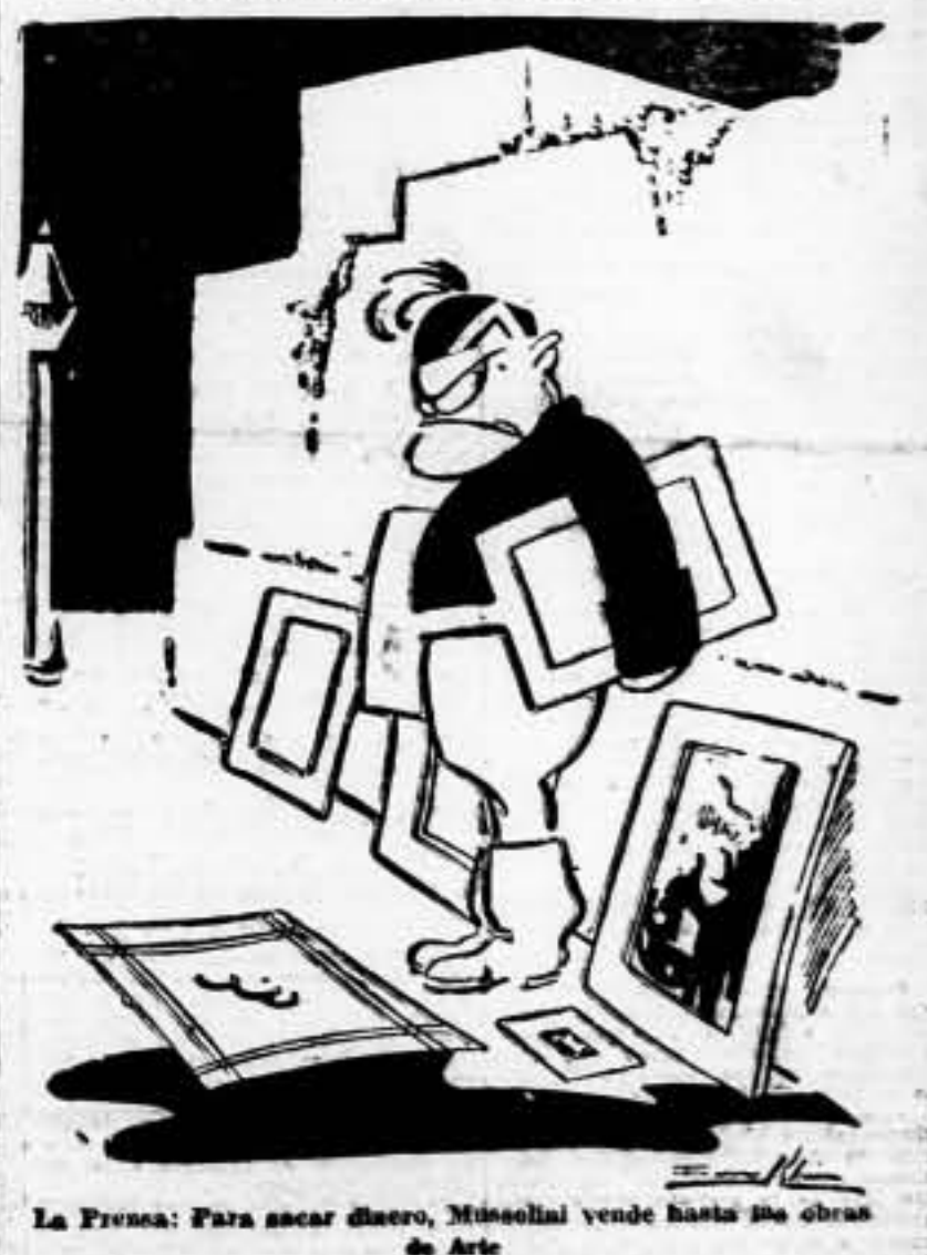
La Prensa: Para sacar dinero, Mussolini vende hasta sus obras de Arte