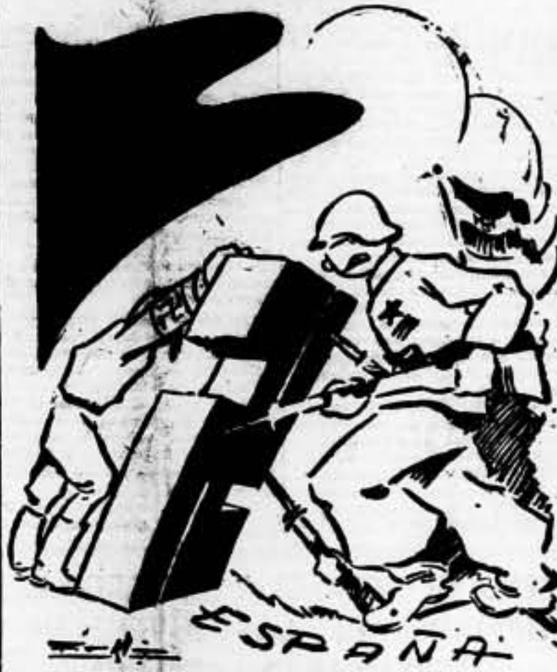
La España popular quebrará la fatídica cruz