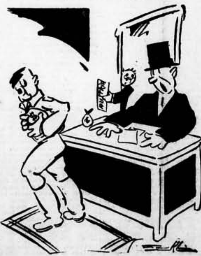
Hitler detras de su escritorio en Garmisch