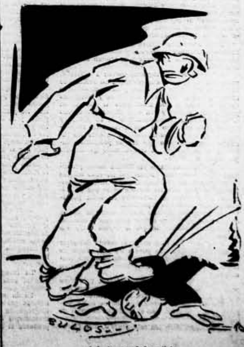
Aplausos al decreto