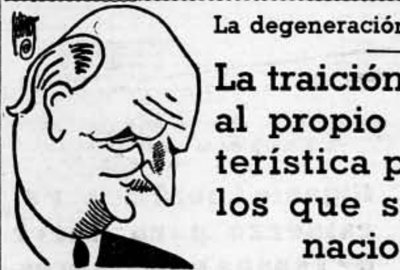
EL EJEMPLO DE LOS DERECHISTAS FRANCESES