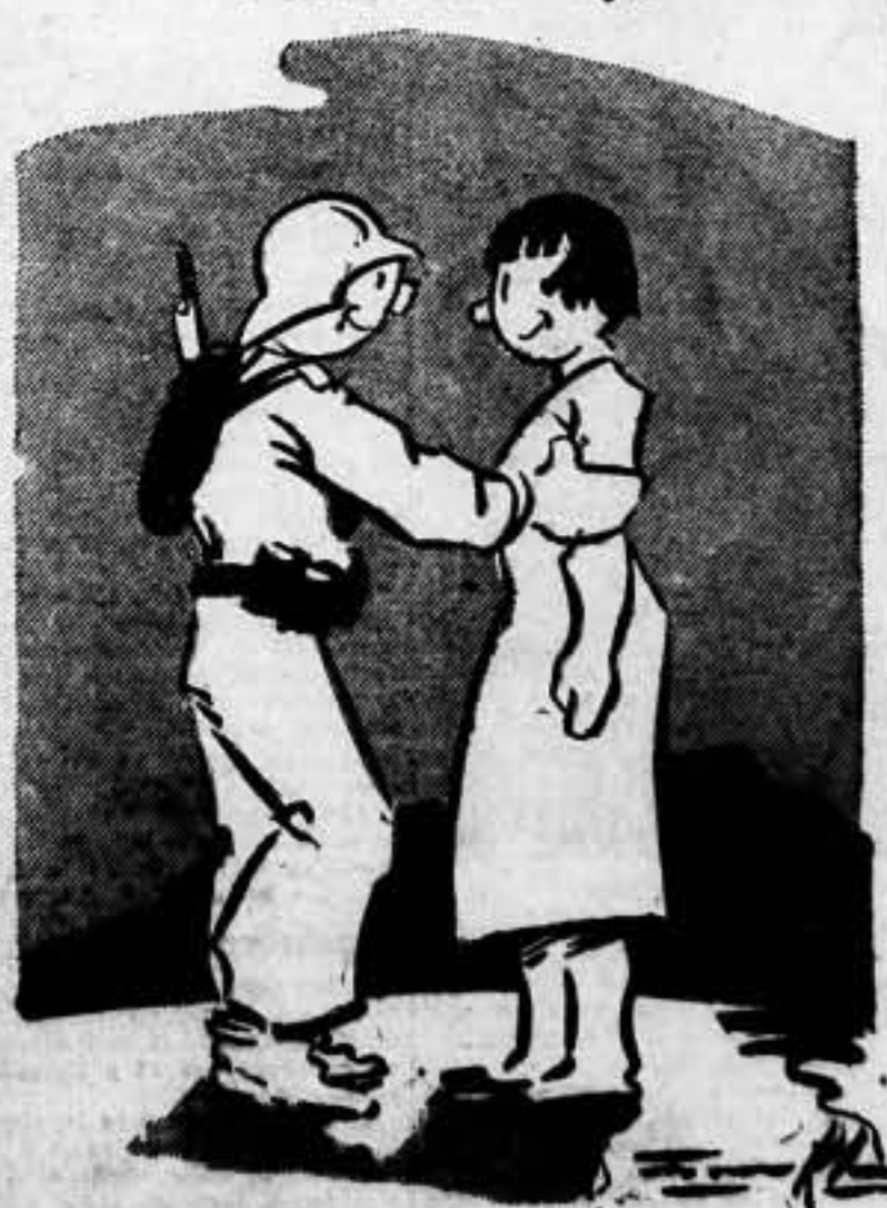
Como es que me ayudaría desde aquí, me voy feliz y contenta.