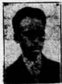
Ivon Delbos, ex-ministro de Relaciones Exteriores de Francia...