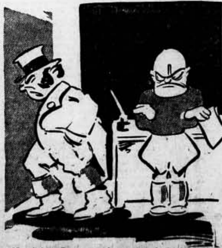
Mussolini.—¿Pero no consigo convencerlos del todo?