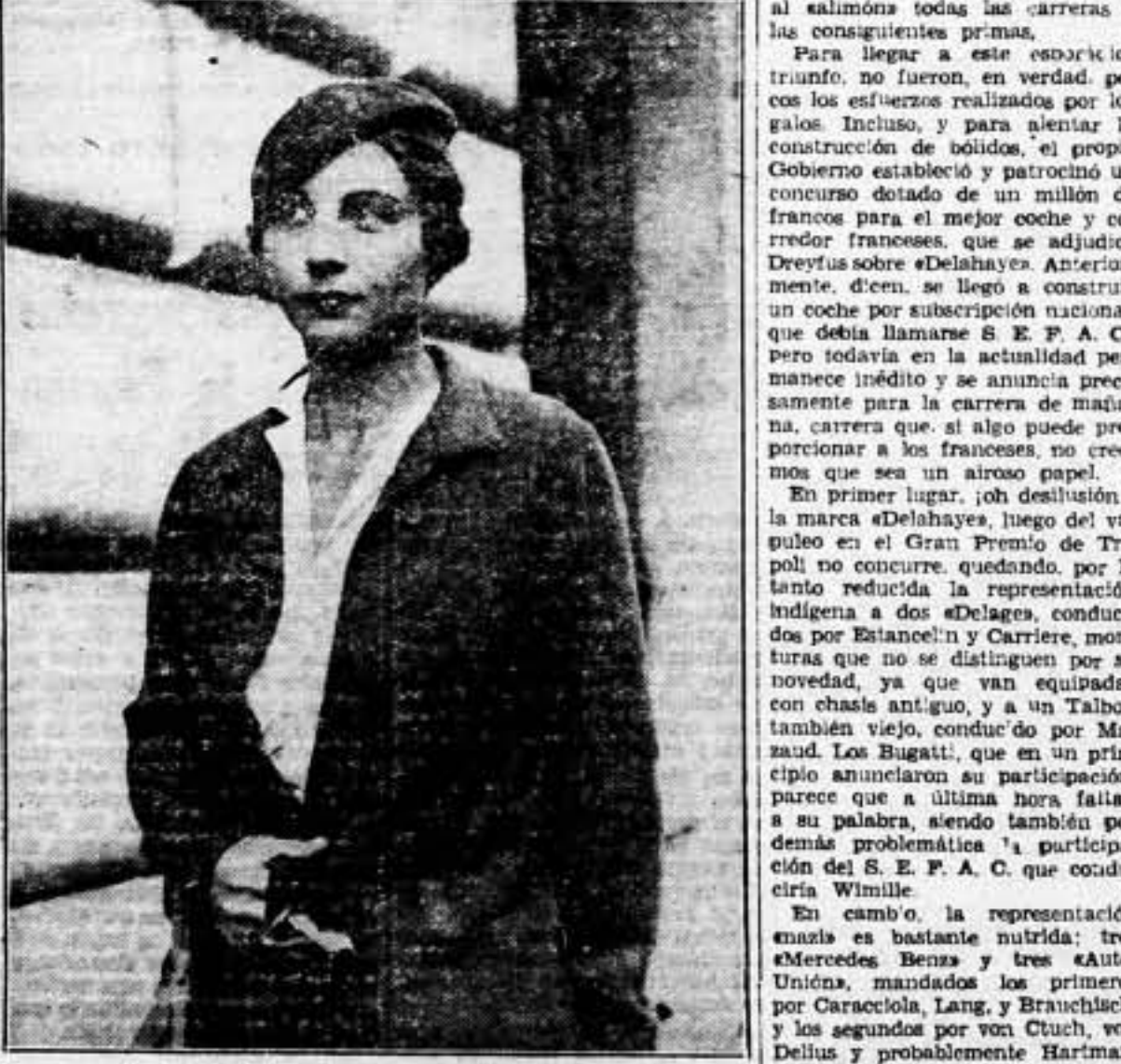
Campeona de Wimbledon en 1937, considerada como la mejor tenista del Mundo, y, a pesar de su forma incoherente, una de las más calificadas aspirantes al triunfo definitivo en la competición actual