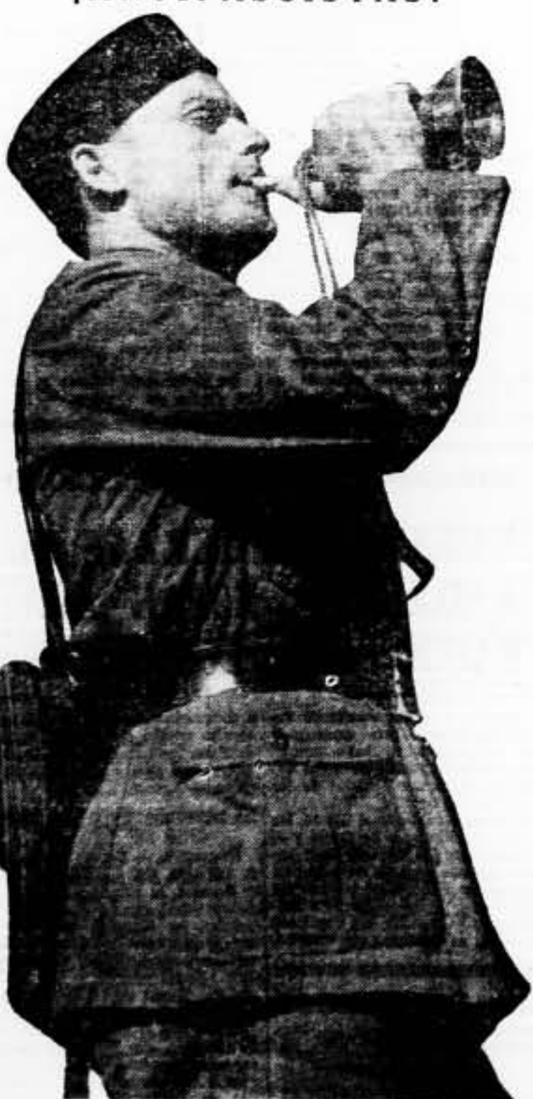
Todos a defender nuestro suelo