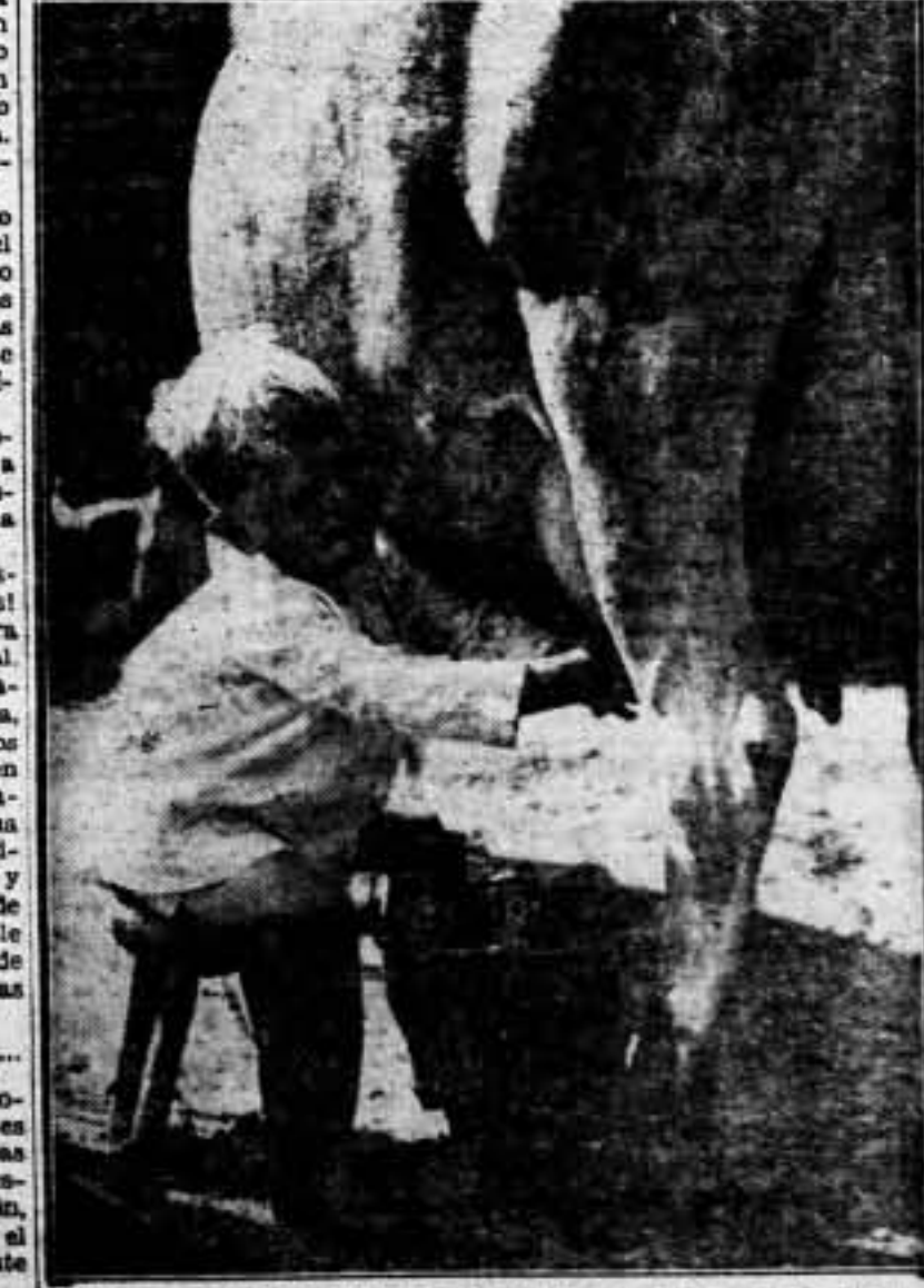
El niño alejado de toda inquietud juega y retora con las ubres de la vaca