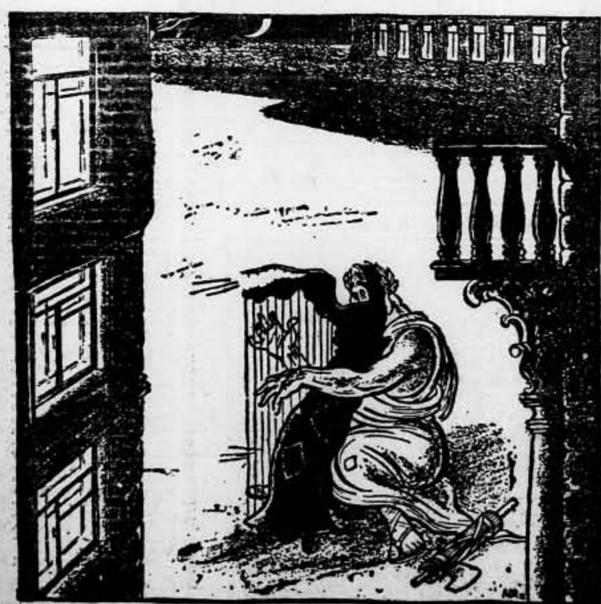
Mussolini improvisa un arpa con la bota italiana, mientras espera incendiar el Mundo