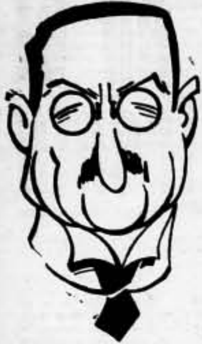
LA SITUACION DE LOS ANTIFASCISTAS SIGNIFICADOS QUE NO PUEDEN FUGARSE

Y nos cuenta su entrevista con una personalidad republicana, que vive escondida en el territorio sublevado