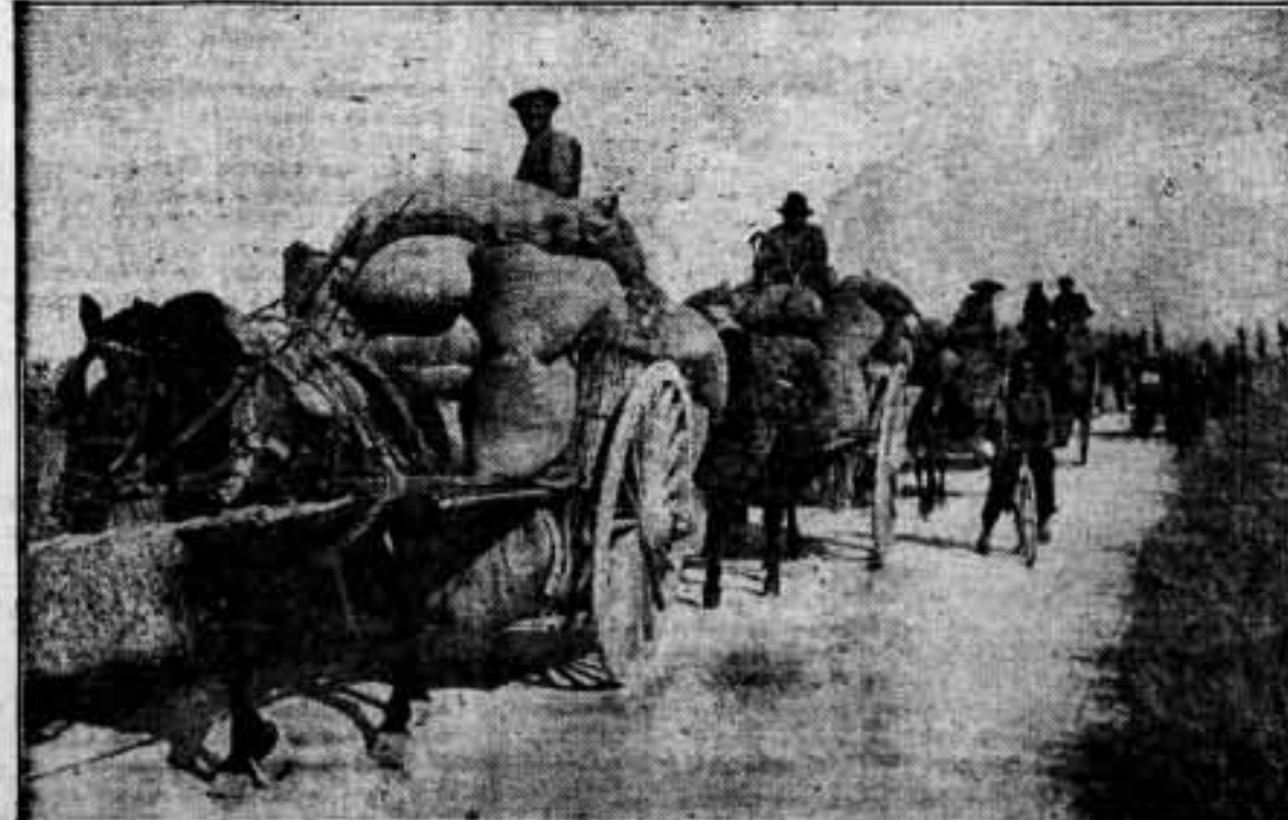
Trabajadores de las Colectividades levantinas transportando el trigo que mañana se transformará en pan para los combatientes